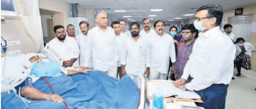
నిమ్మ దవాఖానలో మందుల పరీక్షలు చేసే సందర్భంగా, మాజీ, మంత్రులు, ఎమ్మెల్యేలు, మాజీ ఎమ్మెల్యేలు