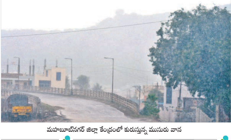
మహబూబ్ నగర్ జిల్లా కేంద్రంలో కురుస్తున్న ముసురు వాన