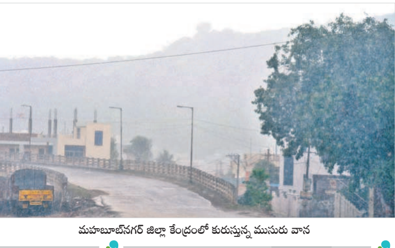
మహబూబ్ నగర్ జిల్లా కేంద్రంలో కురుస్తున్న ముసురు వాన