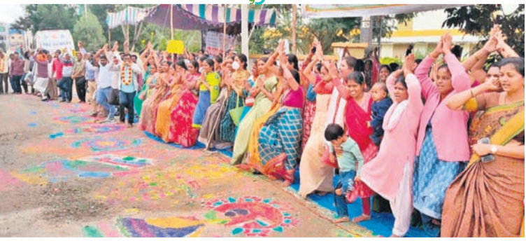
మహబూబ్ నగర్ లో ఒంటికాల్పై నిలబడి నిరసన తెలియజేస్తున్న ఎన్ఎస్పి ఉద్యోగులు