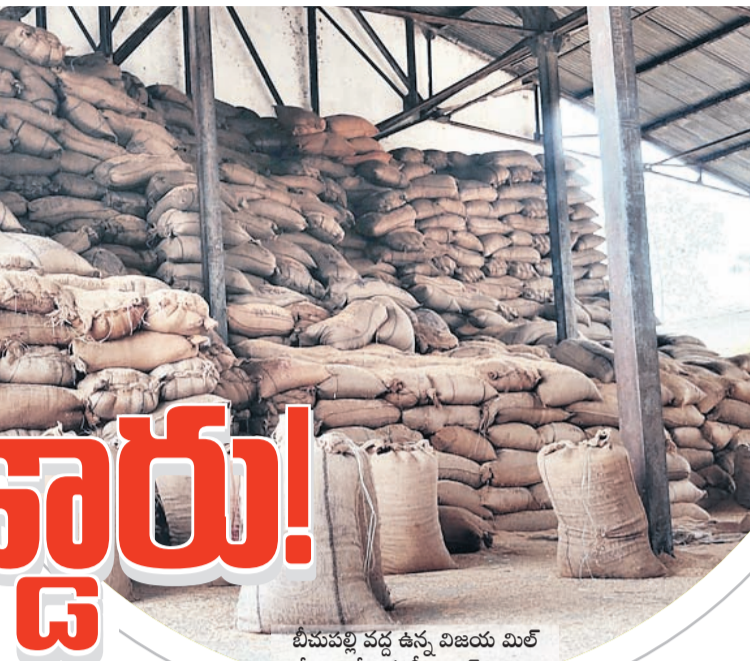
బీబిఎల్ వద్ద ఉన్న విజయ మిల్ గోదాంలో ఉన్న సీఎంఆర్ బస్సులు

అమ్ముకున్నారా.. అపహరించారా..? ప్రతి సీజన్లో జిల్లాలోని మిల్లర్ల ది ఇదే తీరు. ప్రభుత్వం కేటాయింపు సీఎంఆర్ రైస్ దాస్యాన్ని మర ఆడించడానికి మిల్లర్లకు కేటాయింపు ఉంటుంది. అయితే నిల్వ ఉంచుకుంటున్నారని ఆరోపణలు ఉన్నాయి. అయితే బీబిఎల్ వద్ద ఉన్న రైస్ మిల్లర్లకు తీసుకొచ్చింది.