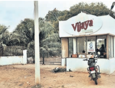
బీబిఎల్ వద్ద ఉన్న విజయ ఐయర్ మిల్

పిప్పివాయి. ఈ విషయం సీఎంఆర్ స్వయం శాఖ అధికారులకు తెలిసినా ఇందులో వారికి కూడా భాగస్వామ్యం ఉండడంతో వారు పట్టించుకోవడం లేదనే ఆరోపణలు వినిపిస్తున్నాయి. నిత్యం వందలాది వాహనాలు తిరిగి జాతీయ రహదారి పక్కనే పోలీస్ బెటాయిన్ సమీపంలో ఉండే బీబిఎల్ ఐయర్ మిల్ గోదాంలో ఉన్న మూడు వందల బస్సుల సీఎంఆర్ రైస్ దాస్యాన్ని గోదాంలో దొంగలు అపహరణ చేశారంటే ఇది సీనియర్ తలపెట్టేలా ఉంది. గోదాంలోని దాస్యం దొంగలు అపహరించారని బాధితుడు ఫిర్యాదు చేసిన రెండు రోజులుగా పోలీసుల విచారణ చేసినా చివరికి ఫలితం శూన్యం.