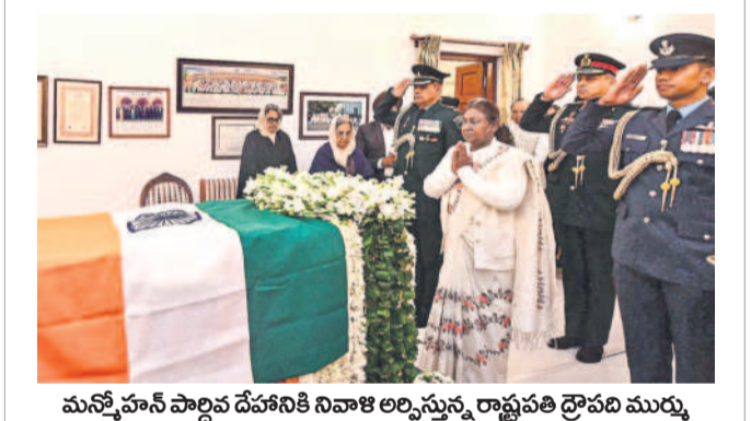
మనోహర్ పార్లమెంట్ దేహానికి నివాళి అర్పిస్తున్న రాష్ట్రపతి ద్రౌపది ముర్ము