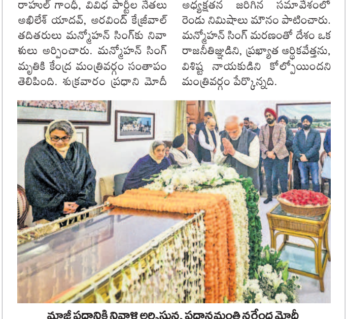
మాజీ ప్రధాని నివాళి అర్పిస్తున్న ప్రధానమంత్రి నరేంద్ర మోదీ

మాజీ ప్రధాని మనోహర్ మృతి పట్ల మలేషియా ప్రధాని అన్వర్ ఇబ్రహీం సంతాపం వ్యక్తం చేశారు. ఈ సందర్భంగా తాను కష్టంలో ఉన్నప్పుడు మనోహర్ చూపిన దయాగుణాన్ని గుర్తుచేసుకున్నారు. తాను జైలులో ఉన్నప్పుడు మనోహర్ తన పిల్లలకు స్కాలర్ షిప్ లు ఇప్పిస్తానని చెప్పినట్లు వెల్లడించారు. మనోహర్ తన మిత్రుడు, సోదరుడు అని ఎక్కడో నివాసి అర్పించారు. అన్వర్ ఇబ్రహీం 1999 నుంచి 2004 వరకు జైలులో ఉన్న సమయంలో మనోహర్ సింగ్ రాజ్యసభలో విపక్ష నేతగా ఉండేవారు. ఆ సమయంలో ఆయన తనకు అండగా ఉండటమే కాక, తన పిల్లల చదువులకు స్కాలర్ షిప్ లను ఆఫర్ చేశారని చెప్పారు.