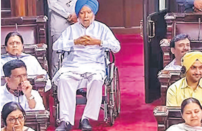
ఇటీవల రాజ్యసభకు వీల్ చైర్ పై హాజరైన మనోహర్ సింగ్

■ లక్ష్యాన్ని గుర్తుచేసే కారు ప్రధాని హోదాలో మనోహర్ లగ్జరీ కార్లలో ప్రయాణించినప్పటికీ ఆయనకు ఒకే ఒక్క సొంతకారు మారుతి 800 ఉండేదని, అదే ఆయనకు ఎంతో ఇష్టమని మనోహర్ హయాంలో స్పెషల్ ప్రొటోక్షన్ గ్రూప్ (ఎస్పీజీ) చీఫ్ గా పనిచేసిన మాజీ ఐపీఎస్ అధికారి ఆరుత్ ఆసిమ్ పేర్కొన్నారు. పీఎం అధికారిక నివాసంలో టీఎం డబ్ల్యూ కారు వెనుక ఈ మారుతి కారు పార్కు చేసేదని తెలిపారు. ఈ కారు ఇక్కడే ఎందుకు ఉందని ఓసారి ప్రశ్నించగా.. 'మారుతిని చూస్తే సామాన్యులకు నేను చేయాల్సిన పని గుర్తుకువస్తుంది' అని మనోహర్ అన్నారు ఆయన గుర్తుచేసుకొన్నారు.