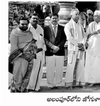
అలంపూర్ లోని జోగుశాంబ అలయంలో జడ్జి కుటుంబ సభ్యులు, అధికారులు

వీఆర్‌ఎస్ వ్యవస్థ చేస్తున్న దారుణాలను గమనించిన కేసీఆర్ ప్రభుత్వం 2020లో సాహసోపేత నిర్ణయం తీసుకున్నది. వీఆర్‌ఎస్ వ్యవస్థను రద్దు చేసింది. దీంతో రాష్ట్రవ్యాప్తంగా రైతులు సలహాలు చేసుకున్నారు. తమ భూములపై ఇతర వ్యక్తుల పేర్లను పోయిందని ఆనందపడ్డారు. 2020లో తెచ్చిన కొత్త రెవెన్యూ చట్టంలో రికార్డులు కంప్యూటర్ లోకి వెళ్లాయి. భూ క్రయవిక్రయాలన్నీ ఆన్‌లైన్ లోనే సాగాయి. రికార్డులు సరళతరం అయ్యాయి. దీంతో గ్రామాల్లో భూ రికార్డుల నిర్వహణ అవసరం లేకుండా పోయింది. వీఆర్‌ఎస్ లకు పనిలేకుండా పోయింది. అందుకే ఆ వ్యవస్థను రద్దు చేశామని నాటి సీఎం కేసీఆర్ చెప్పారు.