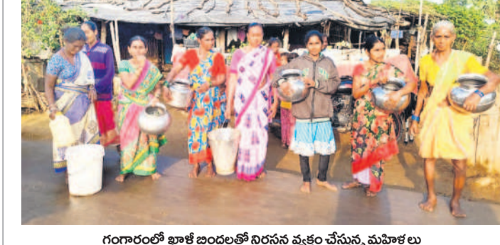
గంగారంలో ఖాళీ బిందెలతో నిరసన వ్యక్తం చేస్తున్న మహిళలు

చెన్నూర్ రూరల్, డిసెంబర్ 28 : తాగు నీటి కోసం ఐదు నెలలుగా ఇబ్బందులు పడుతున్నా అధికారులు పట్టించుకోవడం లేదని, ఈ సమస్య గురించి పట్టణ శుక్రవారం ఖాళీ బిందెలతో నిరసన తెలిపారు. ప్రధాన రహదారిలోని కాలనీ వాసుల ఇళ్లకు తాగునీరు సరఫరా చేసే బోరుకు అవు ర్నిన విడుదల మోటర్ కాలిపోయిందని, పంచాయతీ సెక్రటరీ అందుబాటులో ఉండడం లేదని, ఈ సమస్య గురించి పట్టణ చుక్కపడం లేదంటూ వారు ఆవేదన వ్యక్తం చేశారు. ఇప్పటికైనా సంబంధిత అధికారులు స్పందించి తాగు నీరు అందించాలని కోరారు.