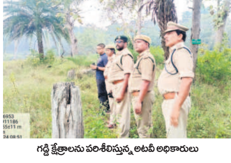
గడ్డి క్షేత్రాలను పరిశీలిస్తున్న లబి అధికారులు

చెన్నూర్ రూరల్, డిసెంబర్ 28 : చెన్నూర్ మండలం కిప్పవేటి గ్రామ సమీపంలోని వర లక్ష్మి జిన్సింగ్ మిల్లో పత్తికి మద్దతు ధర చెల్లించాలని డిమాండ్ చేస్తూ రైతులు ఆందోళనకు దిగారు. శుక్రవారం చెన్నూర్-మంచుర్యాల ప్రధాన రహదారిపై ధర్మా చేపట్టారు. మంగళవారం వరకు పత్తికి మద్దతు ధర క్లింటాలకు రూ. 7520 ఉండగ, ప్రస్తుతం క్లింటాలకు రూ. 100 తగ్గించారని, తగ్గించిన రూ. 100 తిరిగి పెంచాలని డిమాండ్ చేశారు. రోడ్డుకు అడ్డంగా బండ్లు, ట్రాక్టర్లు వేసి సుమారు రెండు గంటల పాటు ధర్మా చేయగా, ఎక్కడిక్కడ వాహనాలు నిలిచిపోయాయి. చెన్నూర్ సీఎంపీ, సీపీఐ రైతులతో మాట్లాడి సన్న జెప్పడంతో వారు ధర్మాను విరమించారు. అధికారుల పర్యవేక్షణ లోకావధానంతో మిల్లు సిబ్బంది ఇష్టానుసారంగా వ్యవహరిస్తున్నారని రైతులు మండి పడ్డారు. జిల్లా స్టాంపు అధికారులు చొరవ తీసుకొని ప్రభుత్వం ప్రకటించిన మద్దతు ధర చెల్లించేలా చూడాలని వారు కోరుతున్నారు.