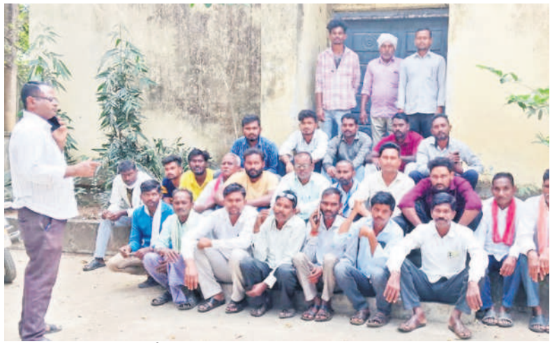
కొటాల : ఎంపీడివో కార్యాలయం ఎదుట ధర్మా చేస్తున్న పంచాయతీ కార్యకులు