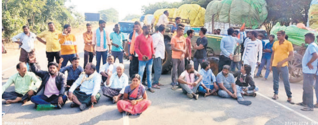
చెన్నూర్ - మంచుర్యాల ప్రధాన రహదారిపై ధర్మా చేస్తున్న రైతులు

కొనసాగుతున్న సమ్మె సమగ్ర శిక్షణ ఉద్యోగుల చేపట్టిన సమ్మె శుక్ర వారం 18వ రోజుకు చేరుకున్నది. ప్రభుత్వం తమ సమస్యలను పరిష్కరించాలని వారు డిమాండ్ చేశారు. అలాగే మాజీ ప్రధాన మంత్రి మన్మోహన్ చిత్తపట్నానికి పూలమాలలు వేసి నివాళులర్పించారు. ఆయన దేశానికి సేవలను కొనియాడారు.