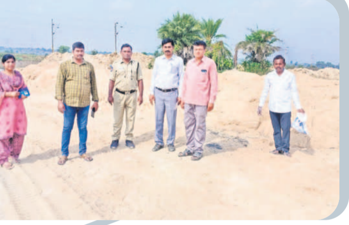
ఇసుక దంపనల సాగింపును చేపట్టడం అధికారులు (ఫైల్)