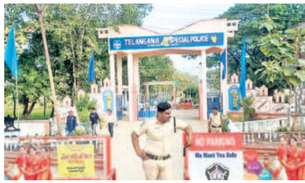
బెటాలియన్ మొయిన్ గేట్ ముందు పోలీసుల బందోబస్తు