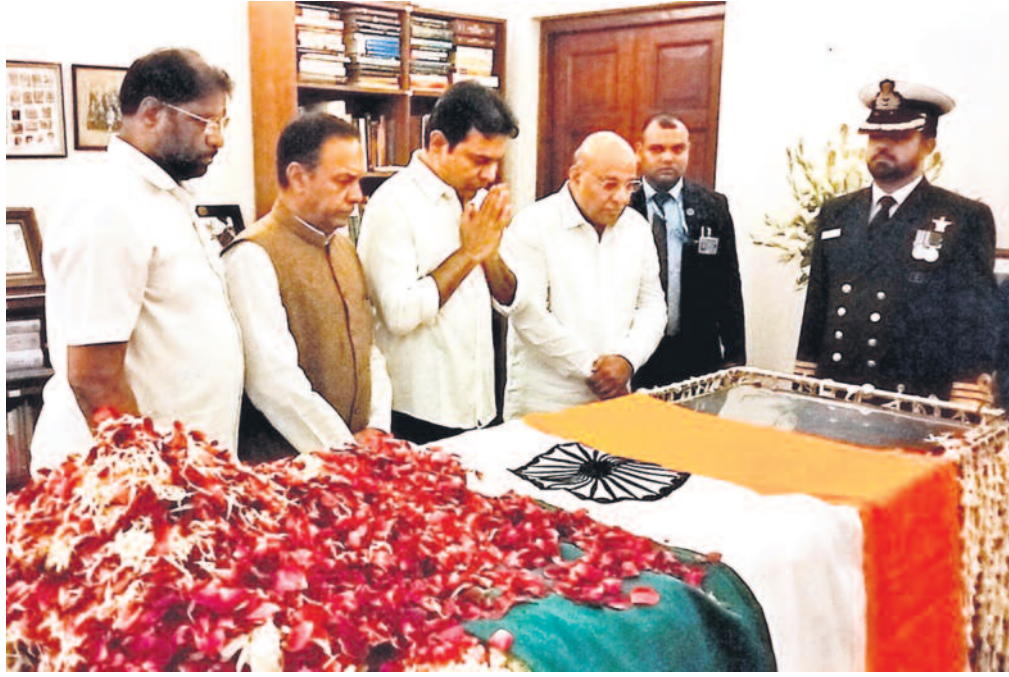
డిల్లీలో మాజీ ప్రధాని మన్మోహన్ సింగ్ పాల్గొన్న పాల్గొన్న బీఆర్ఎస్ వర్కింగ్ ప్రెసిడెంట్ కేటీఆర్, పార్లమెంటులో పాల్గొన్న నేత కేఆర్ సురేష్ రెడ్డి, ఎంపీలు దివకొండ దామోదరరావు, వర్ధిరాజు రవిచంద్ర