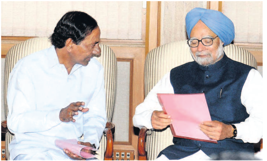
తెలంగాణ రాష్ట్రావిర్భావానికి తుది అడుగులు పడిన తరుణంలో ఢిల్లీలో అప్పటి ప్రధాని మన్మోహన్ సింగ్ కు కేటీఆర్ అయిన ఉద్యమ నేత, బీఆర్ఎస్ అధినేత కేసీఆర్

నవ భారత నిర్మాత, దార్శనికుడు, అసలైన మేధావి, దయపూర్వక మన్మోహన్ సింగ్ పట్ల చరిత్ర దయ, కృతజ్ఞతతో ఉంటుంది. మాజీ ప్రధానమంత్రి డాక్టర్ మన్మోహన్ సింగ్ మృతి పట్ల అయిన స్నేహితులు, కుటుంబానికి నా హృదయపూర్వక సానుభూతి తెలియజేస్తున్నా. అయిన గొప్పదనం రాబోయే తరాలకు స్ఫూర్తినిస్తుంది. రెస్ట్ ఇన్ పీస్ సర్! - కేటీఆర్