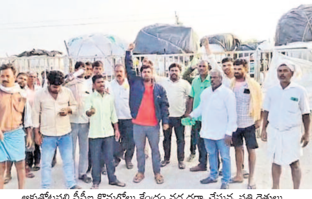
ఆకుతోటపల్లి సీసీబి కొనుగోలు కేంద్రం వద్ద ధర్నా చేస్తున్న పత్తి రైతులు