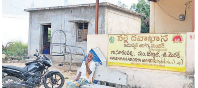
పల్లె దవాఖానం పక్కనే ఉన్న పశు వైద్యశాలలో కొనసాగుతున్న కల్లు దుకాణం

కల్లు దుకాణం నిర్వహణ కోసం గ్రామాభివృద్ధికి రూ.1.50 లక్షలను గ్రామ పెద్దలకు ఫండ్ గా చెల్లించినట్లు స్థానికులు చెబుతున్నారు. కొంతకాలంగా ఈ దుకాణం కొనసాగుతున్నా ఎవరూ పట్టించుకోవడం లేదు. పశువులకు సంబంధిత సమస్యలు ఏమైనా ఉంటే వాటికి వైద్య సేవలు అందించడానికి నిర్మించిన పశు వైద్యశాలలో కల్లుదుకాణం నిర్వహించడంపై స్థానికులు ఆగ్రహం వ్యక్తం చేస్తున్నారు. ఈ విషయం అధికారులకు తెలిసినా వ్యర్థం చేసినట్లు స్థానికులు ఆగ్రహం వ్యక్తం చేస్తున్నారు. పశు వైద్యశాల పక్కనే పల్లె దవాఖానం ఉండడం విషయం, వైద్య సేవల కోసం పల్లె కొత్తగా నిర్మించిన ప్రభుత్వ పశు వైద్యశాలలో కల్లు దుకాణం కొనసాగుతున్నది. ఇక్కడ