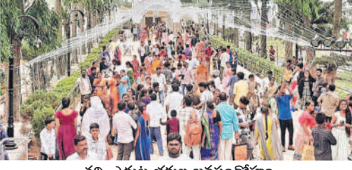
చర్చి ఎదుట భక్తుల జనసందోహం