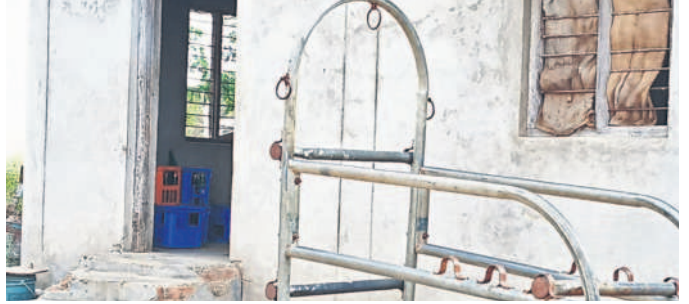
సూరంపల్లి గ్రామంలోని పశువైద్యశాలలో కొనసాగుతున్న కల్లు దుకాణం