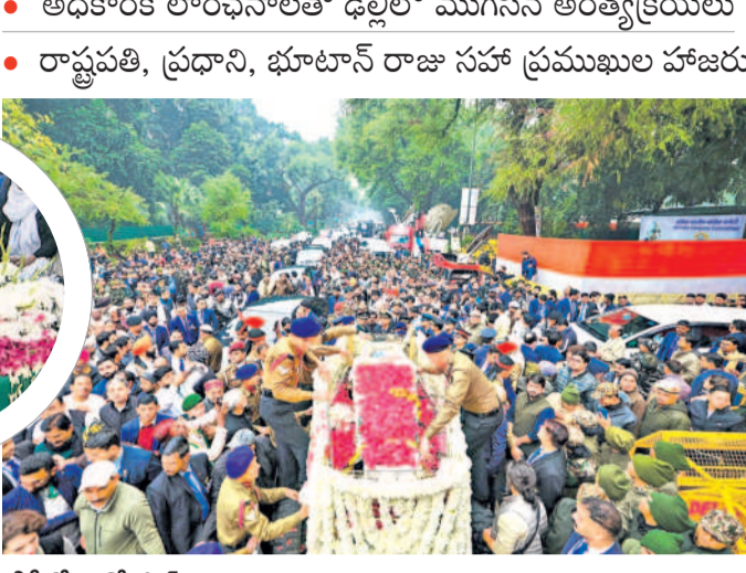
ఢిల్లీలో మన్మోహన్ లంకా ద్వీపం యాత్రకు హాజరైన అనేక జననాపాని

న్యూఢిల్లీ, డిసెంబర్ 28: మాజీ ప్రధాని మంత్రి, ఆర్థికవేత్త మన్మోహన్ సింగ్ ఆదర్శ ప్రస్థానం ముగిసింది. ఢిల్లీలోని సిగ్నల్ గేట్ ఫూట్ లో శనివారం ఆయన అంత్యక్రియలు జరిగాయి. కేంద్రం అధికార లాంఛనాలతో ఆయనకు తుది వీడ్కోలు పలికింది. మన్మోహన్ పిల్లల కుటుంబం అంత్యక్రియలకు హాజరయ్యారు. కేంద్రం అధికార లాంఛనాలతో ఆయనకు తుది వీడ్కోలు పలికింది. మన్మోహన్ పిల్లల కుటుంబం అంత్యక్రియలకు హాజరయ్యారు. కేంద్రం అధికార లాంఛనాలతో ఆయనకు తుది వీడ్కోలు పలికింది. మన్మోహన్ పిల్లల కుటుంబం అంత్యక్రియలకు హాజరయ్యారు.