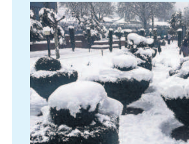
ముందు గుమ్మిట్లో కాక్రీం!

సైన్సర్ గా మాట్లాడేందుకు 2023లో గూగల్ సంస్థ నుంచి హింటన్ బయటకు రావడంతో ఈ టెక్నాలజీని సరిబదింపి ఆయన వ్యక్తం చేసిన ఆందోళనలు మొదటిసారి విమర్శితులయ్యాయి. ఏబి అభివృద్ధి శరేణుగా జరుగుతున్నప్పుడు ఏబి వ్యవస్థలను మరింత తిరిగి వైసీఎం గా మారాలన్న విషయం నిపుణుల అంచనాల పట్ల ఆయన ఆందోళన వ్యక్తం చేశారు. ఏబి రంగంలో జరుగుతున్న అభివృద్ధి తాను ఊహించిన దానికన్నా వాణి వేగంగా ఉందని, దీనిపై ప్రభుత్వ నియంత్రణ అవసరం అవసరమని హింటన్ స్పష్టం చేశారు. బడా కంపెనీలు ఏబి అభివృద్ధిలో వాణి నియంత్రణ చేయవలసివచ్చినట్లుగా, జాగ్రత్తలను పట్టించుకోవని చెప్పారు. భద్రతను సంబంధించి ప్రభుత్వ నియంత్రణ అభివృద్ధి పల్ల ఎదురయ్యే ప్రమాదాల గురించి