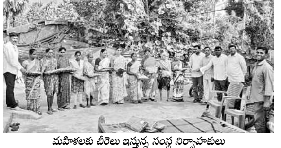
మహిళలకు చీరలు ఇస్తున్న సంస్థ నిర్వాహకులు