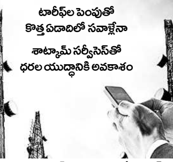
టెలికం సంస్థలకు ఇక్కట్లే! ఫండ్లలో మహిళా ఇన్వెస్టర్ల జోరు

న్యూఢిల్లీ, డిసెంబర్ 28: దేశీయ ఫైబర్ టెలికం సంస్థలకు కొత్త ఏడాదిలో ప్రధానంగా రెండు సవాళ్లు ఎదురవుతున్నాయి. అవకాశాల వివేచనలు పెంచడం వల్ల టెలికం సంస్థలకు ఇక్కట్లవుతున్నాయి. టెలికం సంస్థలకు ఇక్కట్లవుతున్నాయి.