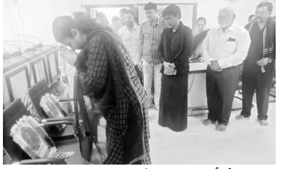
మృతుల చిత్రపటాలకు పూలమాల వేసి నమస్కరిస్తున్న వీవో చిత్రమిత్రా