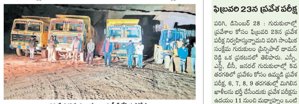
ఎర్రమట్టి తరలిస్తున్న వాహనాలను సీజ్ చేసిన పోలీసులు

వికారాబాద్, డిసెంబర్ 28 : ఎర్రమట్టిని తరలిస్తున్న వాహనాలను పట్టివేసి సీజ్ చేశారు పోలీసులు. పోలీసులు వాహనాలను పట్టివేసి సీజ్ చేశారు. పోలీసులు వాహనాలను పట్టివేసి సీజ్ చేశారు. పోలీసులు వాహనాలను పట్టివేసి సీజ్ చేశారు.