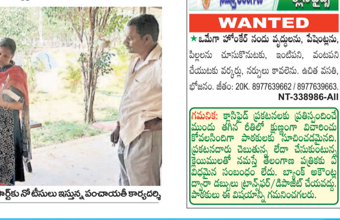
వికారాబాద్, డిసెంబర్ 28 : టిక్ టెక్ రిసార్ట్ కు నోటీసులు ఇస్తున్న పంచాయతీ కార్యదర్శి