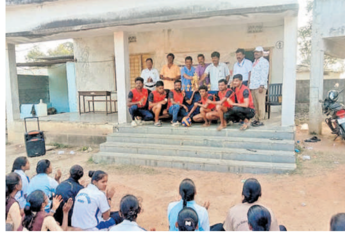
దోమలో వాలిబాల్ బహుమతిని అందుకుంటున్న అయినాపూర్ శివజీ సిన యూత్ యువకులు