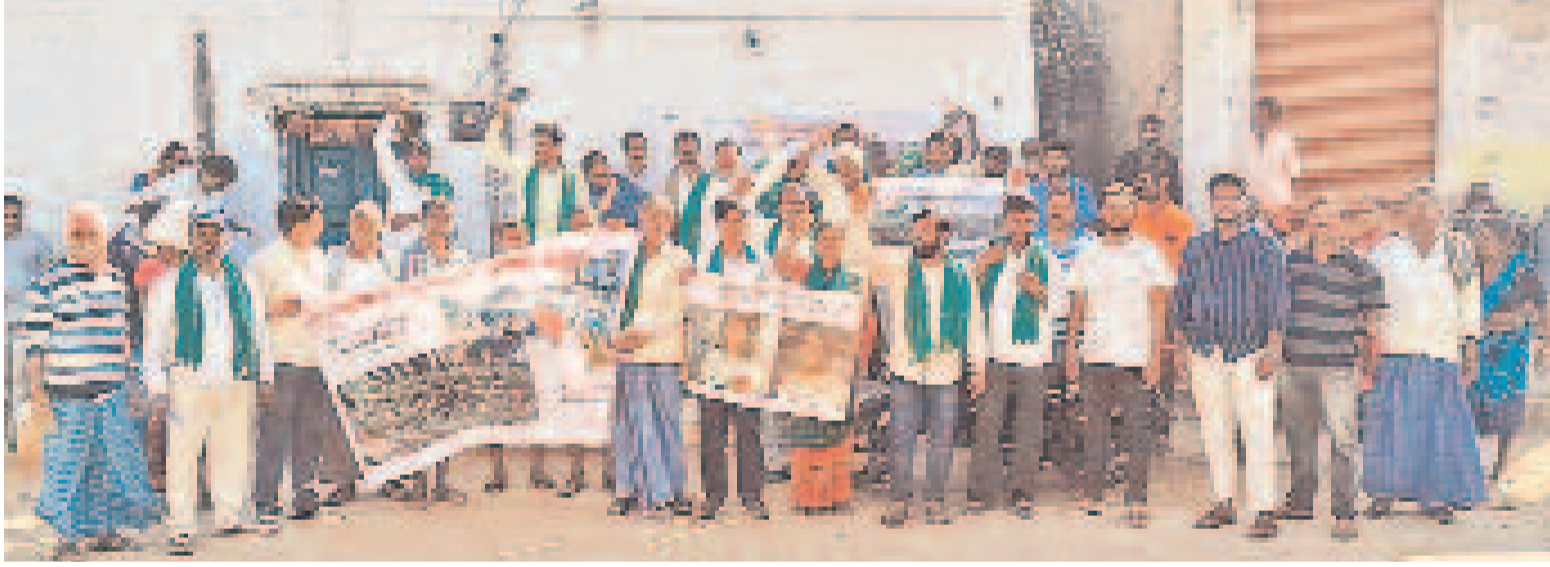
యావారం, కందుకూరు మండలాల్లో ఫార్మాసిటీని ఏర్పాటు చేస్తే తమ ప్రాంతాలన్నీ కాలుష్యమయం అవుతాయని ఆందోళన వ్యక్తంచేస్తూ నిరసనకు దిగిన రంగారెడ్డి జిల్లా కుర్నూర్ గ్రామ రైతులు

రైతు కూలీలకు పైసలేవి భట్టి? 28న రైతు కూలీలకు ఇస్తామన్న భరోసా ఏది? తొలి విడుదలగా ఒక్కొక్కరికి 6 వేలు వేస్తామని ప్రకటన చేసిన గడువు ముగిసినా ఖాతాల్లో పడని డబ్బులు ఇప్పటివరకు కూలీల లెక్క తేల్చని రాష్ట్ర సర్కార్ భట్టిపన్నీ ఉట్టిపాటలేనని విమర్శలు వెల్లువ > 2