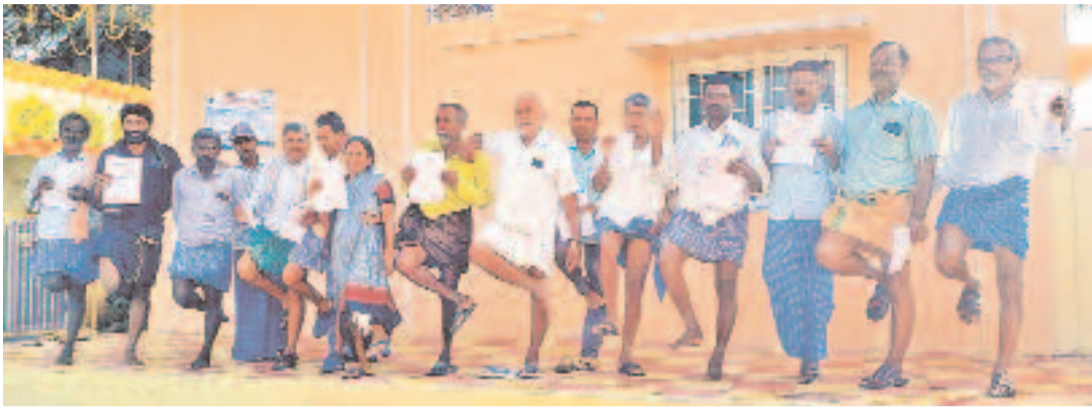
రుణమాఫీపై కాంగ్రెస్ ప్రభుత్వం మాట తప్పిందని, రైతులకు అన్యాయం చేసిందని ఆవేదన వ్యక్తం చేస్తూ.. ఆదివారం గ్రామ పంచాయతీ కార్యాలయం ఎదుట ఒంటి కాల్పై నిలబడి నిరసన వ్యక్తం చేస్తున్న హనుమకొండ జిల్లా కమలాపూర్ మండలం పంగడిపల్లి రైతులు