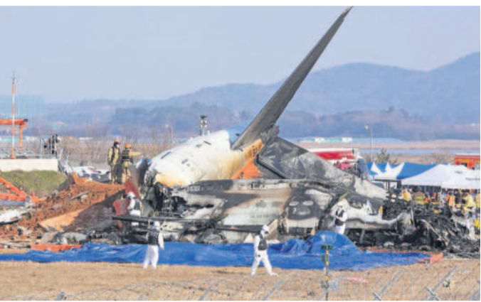
ఆదివారం దక్షిణ కొరియాలోని మువాన్ పట్టణంలో ప్రమాదానికి గురైన విమానం

వీడియోలో కనిపించింది. రన్వేను దాటకుండా ముందుకు దూసుకెళ్లిన విమానం ప్రచార గోడను ఢీకొన్నదం.