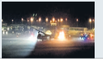
శాంఘైలో ఎయిర్పోర్టుకు విమానాన్ని మళ్లించారు.

శాంఘైలో ఎయిర్పోర్టుకు విమానాన్ని మళ్లించారు. ఎమర్జెన్సీ ల్యాండింగ్ చేస్తున్న సమయంలో రన్వేపై ఆదంపుతప్పి విమానం ముందుకు దూసుకుపోయింది.