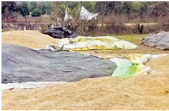
మహబూబాబాద్లోని కొనుగోలు కేంద్రంలో ధాన్యపు రాశులు