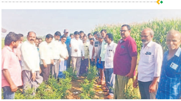
నల్లబెల్లి : రుద్రగూడెంలో పులి సంబంధించిన ప్రాంతాన్ని పరిశీలిస్తున్న మాజీ ఎమ్మెల్యే పెద్ది సుధర్శన్ పెద్ది

14 రోజులైనా పైసలు రాలే.. ఈ నెల 15వ కలెండర్లోని కొనుగోలు కేంద్రాల్లో 8 క్వింటాళ్ళ సన్నరకం ధాన్యానికి కాంటాలా వేశారు. 14 రోజుల క్రితమే బస్టాలు ఎగుమతయ్యాాయి. రెండు రోజుల్లో పైసలు పడుతాయని చెప్పారు. కానీ, ఇప్పటి వరకు పైసలు కూడా బ్యాంకు ఖాతాల్లో పడలే. మరీ ప్రభుత్వం ఇచ్చే బోనస్ కు ఇంకెన్ని రోజులు ఆగాలో అర్థం కావడం లేదు. యాసంగి పెట్టు బడి కోసం బ్యాంకు చుట్టూ తిరగాల్సి వస్తున్నది. - బిర్రగానే చిన్ననారాయణ, రైతు, కేసముద్రం