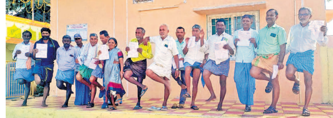
రుణమాఫీపై కాంగ్రెస్ ప్రభుత్వం మాట తప్పిందని, రైతులకు అన్యాయం చేసిందని ఆవేదన వ్యక్తం చేస్తూ.. ఆదివారం గ్రామ పంచాయతీ కార్యాలయం ఎదుట ఒంటికాల్పి నిరసన వ్యక్తం చేస్తున్న హనుమకొండ జిల్లా కమలాపూర్ మండలం పంగడిపల్లి రైతులు