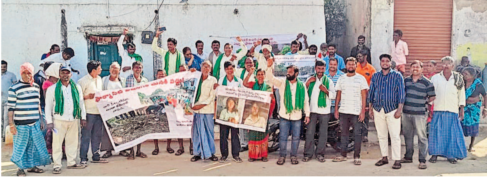
యావారం, కందుకూరు మండలాల్లో ఫార్మాసిటీని ఏర్పాటు చేస్తే తమ ప్రాంతాలన్నీ కాలుష్యమయ్యే అవుతాయని ఆందోళన వ్యక్తంచేస్తూ నిరసనకు దిగిన రంగారెడ్డి జిల్లా కుర్మిడ్ల గ్రామ రైతులు

28న రైతు కూలీలకు ఇస్తామన్న భరోసా ఏది? తొలి విడుదల ఒక్కొక్కరికి 6 వేలు వేస్తామని ప్రకటన చెప్పిన గడువు ముగిసినా ఖాతాలో పడని డబ్బులు ఇప్పటివరకు కూలీల లెక్క తేల్చని రాష్ట్ర సర్కార్ భట్టిపన్నీ ఉట్టిపాటులేనని విమర్శల వెల్లువ >2