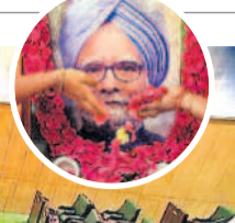
మాజీ ప్రధాని మన్మోహన్ సింగ్ మృతికి సంతాప సూచకంగా సోమవారం రాష్ట్ర శాసనసభలో రెండు నిమిషాలు మౌనం పాటిస్తున్న ఎమ్మెల్యేలు