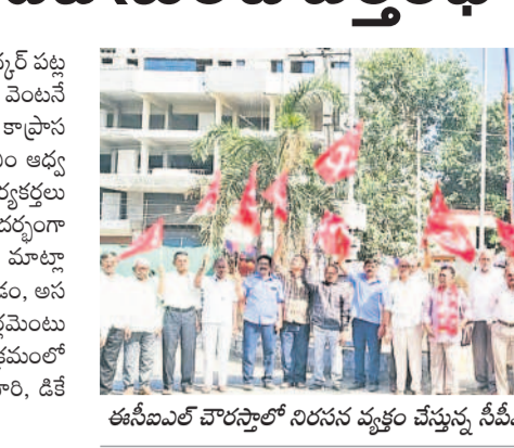
ఈసీఎల్ఐ చౌరస్తాలో నిరసన వ్యక్తం చేస్తున్న సీపీఎం నాయకులు, కార్యకర్తలు