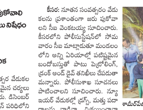
కామిటీపేట పోలీస్ స్టేషన్ వలదిలోని పాముఖేడ్, లిసాద్, ను తనిఖీలు చేస్తున్న సీబి నేతాధికారులు