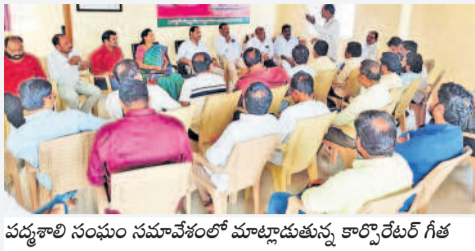
వడ్డూరి సంఘం సమావేశంలో మాట్లాడుతున్న కార్పొరేటర్ గోత