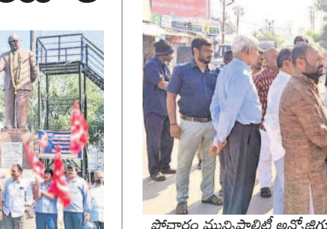
పోచారం మున్సిపాలిటీ అసోసియేట్ వరంగల్ హైవేపై అండర్ పాస్ ఏర్పాటుకు స్థల పరిశీలనకు వచ్చిన డి.ఎం.ఎం. కె.ఎం.ఎం.

ఘట్టేపేట, డిసెంబర్ 30: పోచారం మున్సిపాలిటీ అసోసియేట్ వరంగల్ హైవేపై నిర్మాణం చేపట్టే అండర్ పాస్ నిర్మాణానికి స్థలాన్ని సోమవారం మల్కాజ్ గిరి ఎంపీ ఈటల రాజేందర్ పరిశీలించారు. మున్సిపాలిటీ ప్రజా ప్రతినిధులు, టీడీపీ నాయకులతో కలిసి ఇక్కడి ఎన్.టి.ఎస్.ఎల్. చౌరస్తాపై అండర్ పాస్ నిర్మాణం ఏర్పాటు చేసే పరిశీలించారు. అండర్ పాస్ నిర్మాణంతో ఏ ఏ ప్రాంతాల ప్రజలకు సౌకర్యంగా ఉంటుంది ఎంపీకి వివరించారు. ప్రధానంగా అండర్ పాస్ లేకపోవడంతో జరిగే ప్రమాదాలను వివరించారు. త్వరగా ఇక్కడి అండర్ పాస్ నిర్మాణం ఏర్పాటు చేసి ప్రమాదాలను నివారించాలని ఇక్కడి ప్రజా ప్రతినిధులు కోరారు. పోచారం చైర్మన్ కొండల్ రెడ్డి, మాజీ ఎంపీ సుదర్శనరెడ్డి, కొన్నెప్ప, నాయకులు పాల్గొన్నారు.