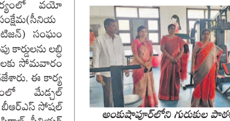
అంతాపూర్లోని గురుకుల పాఠశాలను సందర్శించి జి.ఎమ్.వలదిలోని సర్వ జాయింట్ సెక్టర్ శాసన