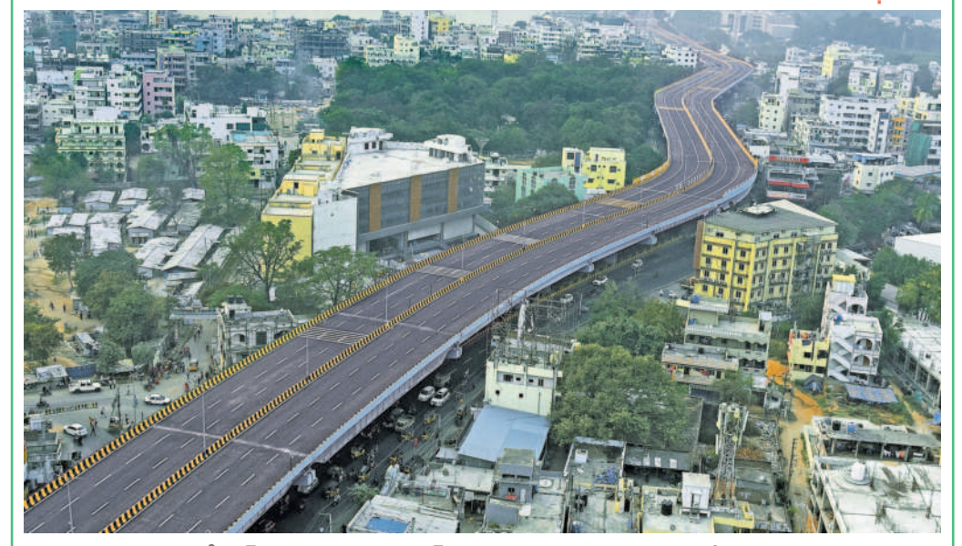
కేబిఆర్ చుట్టూ పై పై బల్లియా, అండర్ పాని.. సవాలీగా మారిన అస్తుల సేకరణ

అస్తుల స్వాధీనంపై స్పష్టత లేకుండానే హెచ్ సిటీ ప్రాజెక్టు పనులకు శంకుస్థాపన