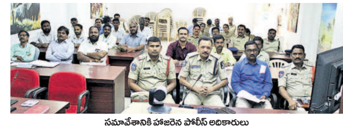
సమావేశానికి హాజరైన పోలీస్ అధికారులు

వికారాబాద్, డిసెంబర్ 30 : బాలలను పనిలో పెట్టుకుంటే చర్యలు తప్పవని అదనపు ఎస్పీ చూసుచంద్ర రావు హెచ్చరించారు. సోమవారం డీవీఓ వికారాబాద్ సమావేశ మందిరంలో జనపరిశో నిర్వహించే ఆసరిషన్ స్టేట్-11 కార్యక్రమంలో భాగంగా అనుబంధ శాఖల అధికారులతో సమన్వయ సమావేశం నిర్వహించారు. ఈ సందర్భంగా ఆయన మాట్లాడుతూ.. జీవితంలో బాల్యం లేకుంటే ఎంతో కోర్కొయిన వారప్రకారంగా.. జిల్లాలో జనపరి ఒకతో తేదీ నుంచి 31