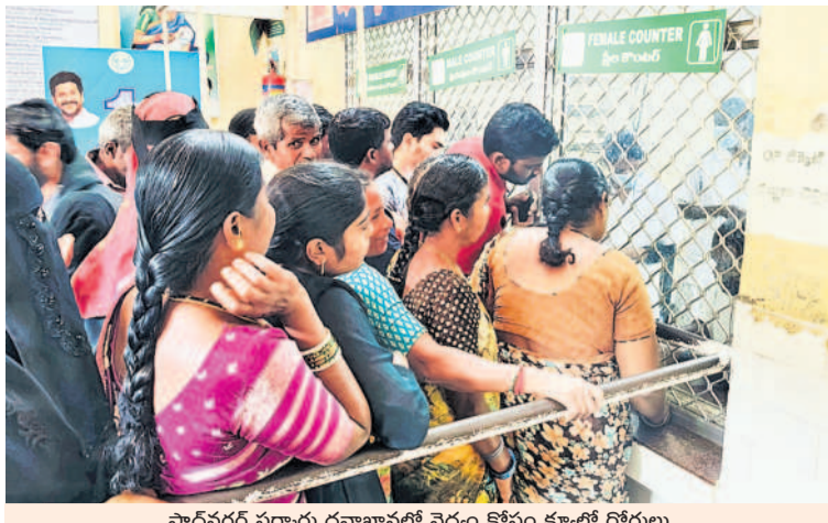
షాద్‌నగర్ సర్కారు దవాఖానలో వైద్యం కోసం క్యూలో రోగులు