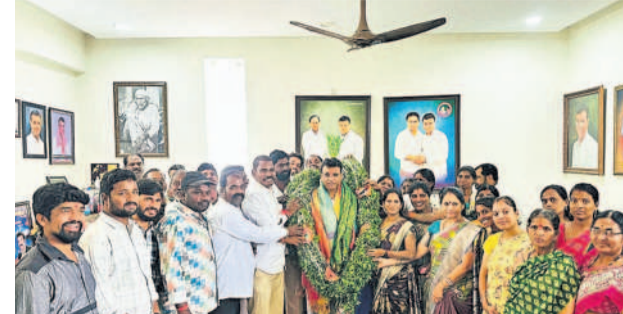
నూతన సంవత్సరాన్ని పురస్కరించుకుని కుత్బుల్లాపూర్ ఎమ్మెల్యే కేటీ ఆర్ వివేకానంద్ కు నూతన సంవత్సర శుభాకాంక్షలు తెలిపి, గజమాలతో సత్కరిస్తున్న స్థానిక బీఆర్‌ఎస్ నాయకులు, కార్యకర్తలు, ప్రజలు