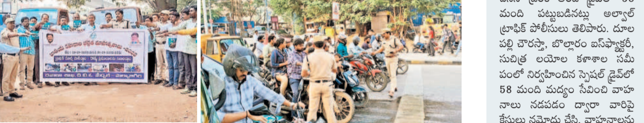
కేపీహెచ్ బీ కాలనీలో రోడ్డు నిబంధనలపై అవగాహనలో వాటర్ ట్యాంకర్ డ్రైవర్లు, ఓనర్లతో ప్రత్యేక సమావేశం ఏర్పాటు చేసి నేతలు

రహదారుల నిబంధనలు పాటించి.. బంగారు భవిష్యత్ ను కాపాడుకోవాలి : కూకట్‌పల్లి ఎంపీ సీనియర్ నేతలు