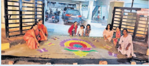
మియాపూర్‌లో ముగ్గులతో స్వాగతం పలుకుతున్న మహిళలు, చిన్నారులు