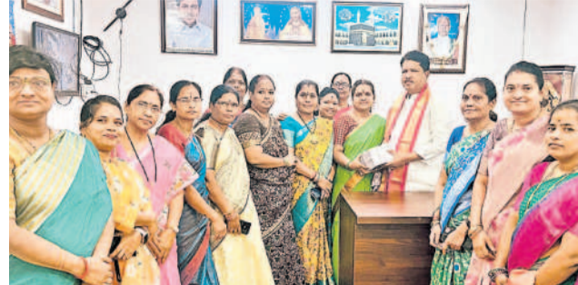
కూకట్‌పల్లి ఎమ్మెల్యే మాధవరం కృష్ణారావుకు నూతన సంవత్సర శుభాకాంక్షలు తెలుపుతున్న బీఆర్‌ఎస్ పార్టీ మహిళా నేతలు