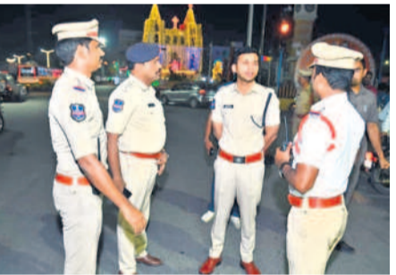
మంగళవారం అర్ధరాత్రి నల్లగొండ డ్రాఫ్ట్ డివిజన్ సెంటర్లో పోలీస్ సిబ్బందికి నూతన సంవత్సరం వేడుకలు

నిలగిరి, జనవరి 1 : నల్లగొండ జిల్లాలో నూతన సంవత్సర వేడుకలు ప్రశాంతంగా సాగాయి. డిసెంబర్ 31 రాత్రి వేడుకల వేడుకలతో జిల్లా పోలీసులు అనుసరించిన వ్యూహం తో ఎలాంటి అవాంఛనీయ ఘటనలూ చోటుచేసుకోలేదు. ఒక్క ప్రమాదంకూ జరుగలేదు. జిల్లాకేంద్రంలో నాలుగు రోజులపాటు చేపట్టిన ఆపరేషన్ చతుశ్రతో అంతా సుస్వంగా సాగింది. శాంతి భద్రతల విభాగం అధికారులతో పాటు ట్రాఫిక్ పోలీసులు మంగళవారం రాత్రి అంతా విధుల్లోనే ఉన్నారు. జిల్లావ్యాప్తంగా ఫ్లావేలు, పట్టణాల్లోని ప్రధాన రహదారులపై నిరంతరం పెట్రోలింగ్ నిర్వహించారు. వేడుకలు జరుపుకోనే క్రమంలో ఎవరూ ఇతరులకు ఇబ్బంది కలిగించకుండా చర్యలు తీసుకున్నారు. మధ్య తాగి వాహనం నడపడం, ర్యాష్ డ్రైవింగ్, డ్రైవ్ లో డ్రైవింగ్ ఎక్కడిక్కడ అడ్డుకట్ట వేశారు. గతంలో జరిగిన ప్రమాదాలను దృష్టిలో ఉంచుకుని ముందు జాగ్రత్తగా నల్లగొండ జిల్లా కేంద్రంలోని హైదరాబాద్ రోడ్డు, దేవరకొండ రోడ్డు, ప్రకాశం బజార్లో వన్వే డ్రైవింగ్ పనిచేస్తున్నాడు. ప్రధాన రహదారుల్లో బారీకేడ్లు ఏర్పాటు చేసిన వాహనదారులు వేగంతో క్రేక్ వేశారు. ఎన్నో శరత్ చంద్ర పవార్ స్వయంగా పట్టణంలోని తిరిగి చర్యకేంద్రం చారు. నల్లగొండ జిల్లాకేంద్రంలో 246 మంది మధ్య తాగి వాహనాలు నడపడం పోలీసులకు