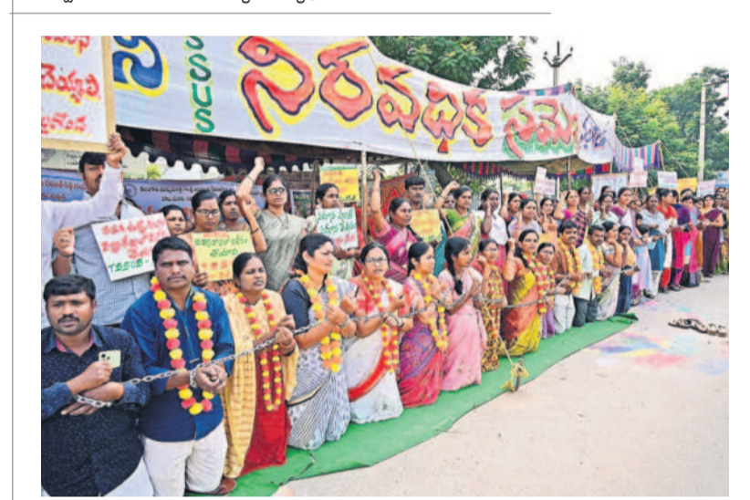
నల్లగొండ కలెక్టరేట్ వద్ద సంకెళ్ల వేసుకుని నిరసన వ్యక్తం చేస్తున్న సమగ్ర శిక్ష ఉద్యోగులు