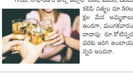
నల్లగొండ సీట్, జనవరి 1 : నూతన సంవత్సర వేడుకల సందర్భంగా నల్లగొండ జిల్లాలో మద్యం విక్రయాలు జోరుగా సాగాయి. డిసెంబర్ 31 రాత్రి ఒక్కరోజే రూ.12 కోట్ల మద్యం అమ్మకాలు జరిగినట్లు ఎక్సైజ్ శాఖ లెక్కలు చెబుతున్నాయి. జిల్లాలో 155

వైన్లతోపాటు బార్లు ఉండగా.. వైన్ల అర్ధరాత్రి 12 గంటలు, బార్లు ఒంటి గంట వరకు తెరిచి ఉంచారు. మరోవైపు మాంసం విక్రయాలు కూడా వెచ్చుతున్న జరిగాయి. సాధారణ రోజుల్లో జిల్లాలో వివెన్, మటన్, చేపలు కలిపి నిత్యం రూ.50ల క్షల మేర అమ్మకాలు ఉండగా, మంగళవారం దాదాపు రూ.కోటివరకు వరకు జరిగి ఉంటాయన్నది అంచనా.