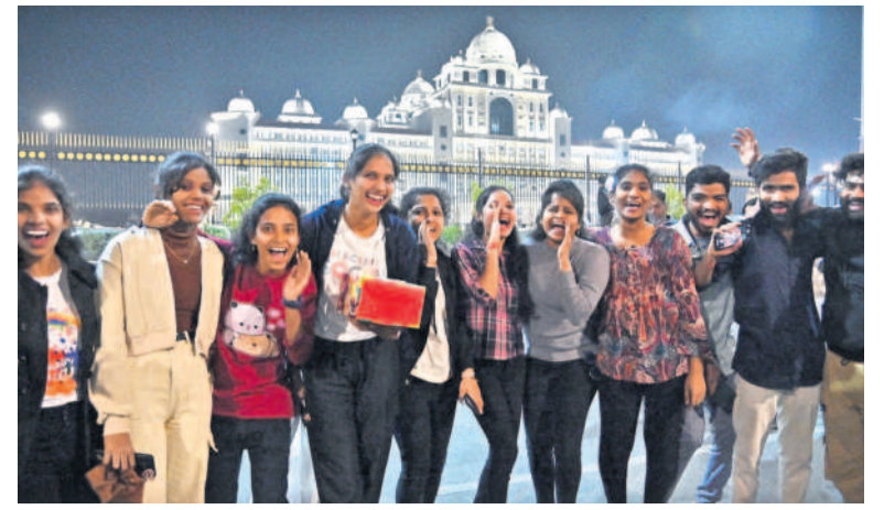
నూతన సంవత్సర వేళ.. ట్యాంకొంట్ పై యువత కేరిత