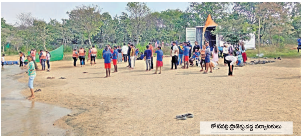
కోట్పల్లి ప్రాజెక్టు వద్ద పర్యాటకులు

వ్యాపారస్తుల వద్దకు వెళ్లి బేరసారాలు అడుగుతున్నట్లు ఆరోపణలున్నాయి. ఉదాహరణకు రూ. లక్ష ఇచ్చే వారి దగ్గర రూ. 50వేల వరకు తీసుకుని వదిలేస్తున్నారు. సదరు వ్యాపారస్తుడి నుంచి వచ్చిన ఫీజు బట్టియా ఖజానాకు చేరడం లేదన్న ఆరోపణలు లేకపోలేదు. ఈ నేపథ్యంలోనే క్షేత్రస్థాయిలో ఒకే చోట తిప్పి వేసిన వారి పట్ల, ఆరోపణలు ఉన్నవారిని, సంస్థాగత లోపాలను సరిదిద్ది ట్రేడ్ లైసెన్స్ లను గాడిన పెట్టాల్సిన చోట చూడాల్సి చర్యలకే చరమితువుతున్నారన్న విమర్శలు ఉన్నాయి. ఫలితంగానే ట్రేడ్ లైసెన్స్ వసూళ్ల ప్రతి ఏటా గణనీయంగా తగ్గముఖం పడుతున్నాయన్న చర్చ జరుగుతున్నది.