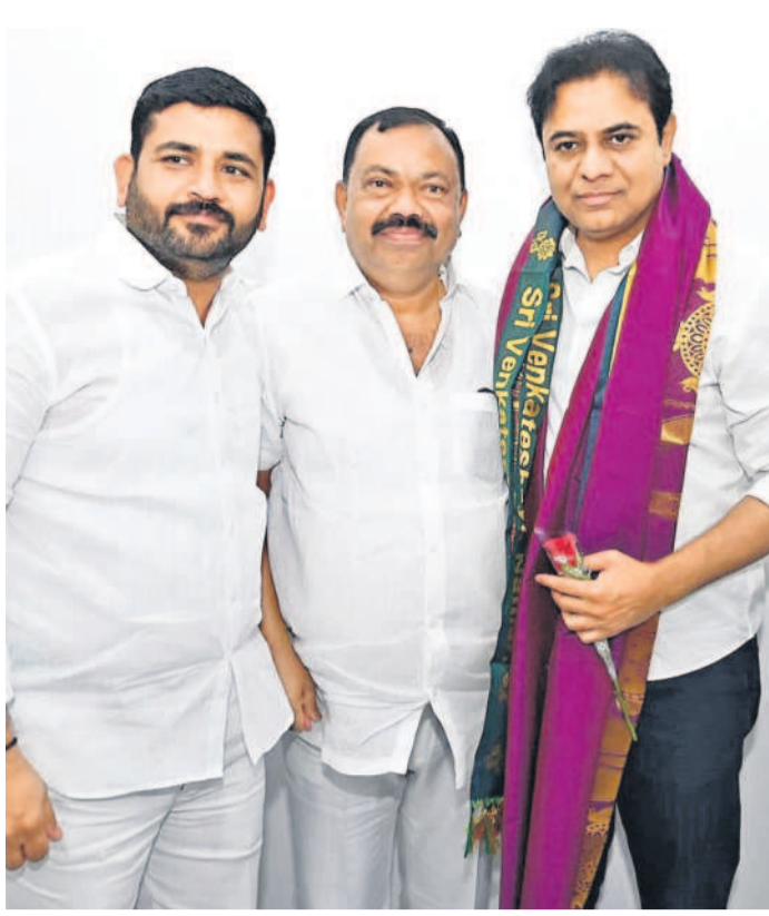
మాజీ మంత్రి కేటీఆర్ కు నూతన సంవత్సర శుభాకాంక్షలు తెలుపుతున్న క్యామె మల్టీకే