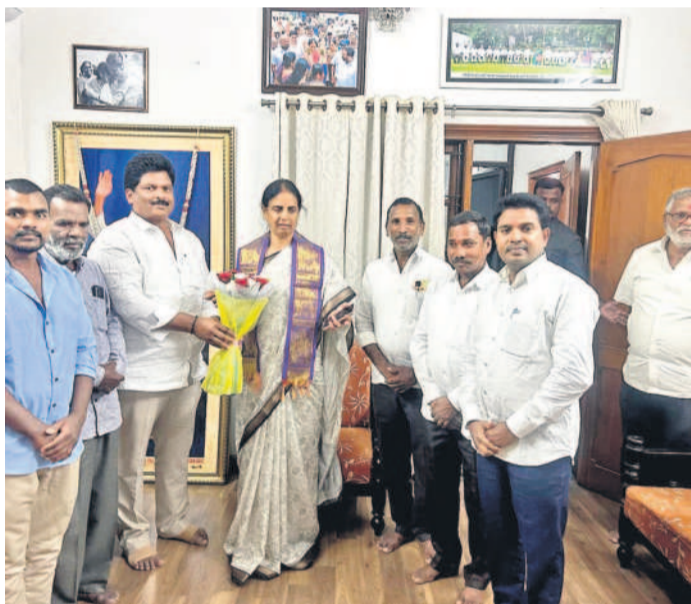
మాజీ మంత్రి, మహేశ్వరం ఎమ్మెల్యే సజితారెడ్డిని కలిసి శుభాకాంక్షలు తెలుపుతున్న జిఆర్ఎస్ శ్రేణులు