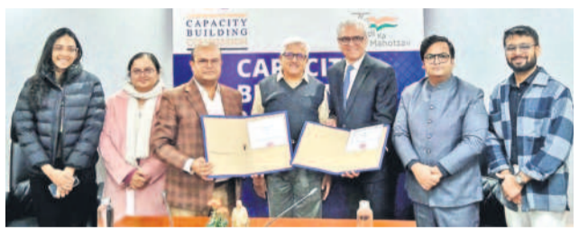
డిజిటీల్ కెపాసిటీ బిల్డింగ్ కమిషన్లో అవగాహన ఒప్పందం చేసుకుంటున్న కౌంట్రీ సూల్ అండ్ పబ్లిక్ పాలసీ

కోటాలో 95 పోస్టులుండగా, దాదాపు 8వేల మంది దరఖాస్తు చేసుకున్నారు. ఫలితాలు ప్రకటించిన తర్వాత, సాఫ్ట్వేర్ కోటా సర్టిఫికేట్ వెరిఫికేషన్ బాధ్యతను సాఫ్ట్వేర్ అధికారి ఆఫీసర్లు (కాట్స్) అప్పగించారు. 393 మంది అభ్యర్థులు సర్టిఫికేట్ వెరిఫికేషన్కు హాజరయ్యారు. సవ్యంగా తేలిక 33 మందికి ఉద్యోగాలిచ్చారు. మిగిలిన అభ్యర్థులకు సాఫ్ట్వేర్ కోటా యంత్రాంగం అభ్యర్థులతో ఓపెన్ కోటాకు మళ్లించి భర్తీచేశారు. అయితే సాఫ్ట్వేర్ కోటా సర్టిఫికేట్ వెరిఫికేషన్ ప్రక్రియ పలువురు అభ్యర్థులకు వ్యక్తం చేశారు. దీంతో తొలుత ఆఫీసర్ మొదటి వారంలో సర్టిఫికేట్ వెరిఫికేషన్ చేపట్టగా, నవంబర్ 20, 21, 22 తేదీల్లో మరోసారి నిర్వహించారు. నవంబర్లో కింది స్థాయి అధికారులు (లో లెవెల్ కమిటీ) సర్టిఫికేట్ వెరిఫికేషన్ను నిర్వహించారు, మరో కమిటీ సర్టిఫికేట్ వెరిఫికేషన్ నిర్వహిస్తుంది. తాజాగా 393 మంది అభ్యర్థులకు సమాచారమిచ్చారు. దీంతో సాఫ్ట్వేర్ కోటా టీడపి పోస్టుల భర్తీలో అక్రమాలు జరిగాయన్న ఆసమాచారాలు మరింతగా బలపడుతున్నాయి.