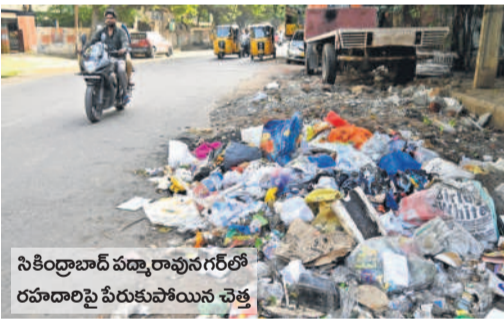
సికింద్రాబాద్ వద్ద రావులగల్లో రహదారిపై పేరుకుపోయిన వ్యర్థ

అమడ దూరంలో కాన్సిల్.. ముందు నెలలకోసారి జరగాల్సిన సర్వేసభ్య సమావేశం ఐదు నెలలు గడిచినా పట్టణ యంత్రాంగం 'స్టాండింగ్' సమావేశాల బాటలోనే పాలక మండలి చట్టాల అమల్లో అలసత్వం.. కమిషనర్ వైఖరిపై అసంతృప్తి సిటీబ్యూరో: జీవోఎంసీలో పాలన గాడి తప్పతోంది. ఐజానాలో చిల్లిగపల్లి లేక అభివృద్ధి పనులు కుంటున్న పరిస్థితులు నెలకొన్నాయి. ఫోలోగిలో ఉన్న పనులు సకాలంలో పూర్తి చేయకుండా నెలల తరబడి కాలయాపన చేస్తున్నారు. అన్నింటికంటే ముఖ్యంగా ప్రస్తుత చట్టాల ఉల్లంఘన జరుగుతున్నది. వాస్తవంగా ప్రతి వారానికొకసారి స్టాండింగ్ కమిటీ సమావేశం జరగాలి. మేయర్ అధ్యక్షతన జరిగే ఈ సమావేశంలో 15 మంది స్టాండింగ్ కమిటీ సభ్యులు పలు అభివృద్ధి పనుల ప్రతిపాదనలపై చర్చించి రూ. 2 కోట్ల నుంచి రూ. 3 కోట్ల మేర విలువైన పనులకు ఆమోదం దక్కతుంది. గడిచిన కొన్ని నెలలుగా స్టాండింగ్ కమిటీ ముందుకు ఎవ్వరూ అంశాలు రాకుండా సమావేశాలు వాయిదా వేస్తూ వస్తున్నాయి. దీంతో ప్రజా సమస్యలు మరింత జటిలమవుతున్నాయి. అభివృద్ధి పనులపై నిర్లక్ష్యం చేయడం వల్ల ప్రజలు సైతం ఆగ్రహం వ్యక్తం చేస్తున్నారు. తాజాగా ఈ కోవలోకి ప్రతి మూడు నెలలకోసారి జరగాల్సిన సర్వే