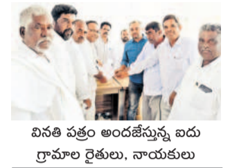
వినతి పత్తం అందజేస్తున్న ఐదు గ్రామాల రైతులు, నాయకులు