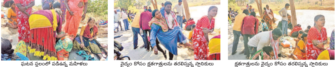
ఘటన స్థలంలో పడిఉన్న మహిళలు వైద్యం కోసం క్షతగాత్రులను తరలిస్తున్న స్థానికులు క్షతగాత్రులను వైద్యం కోసం తరలిస్తున్న స్థానికులు