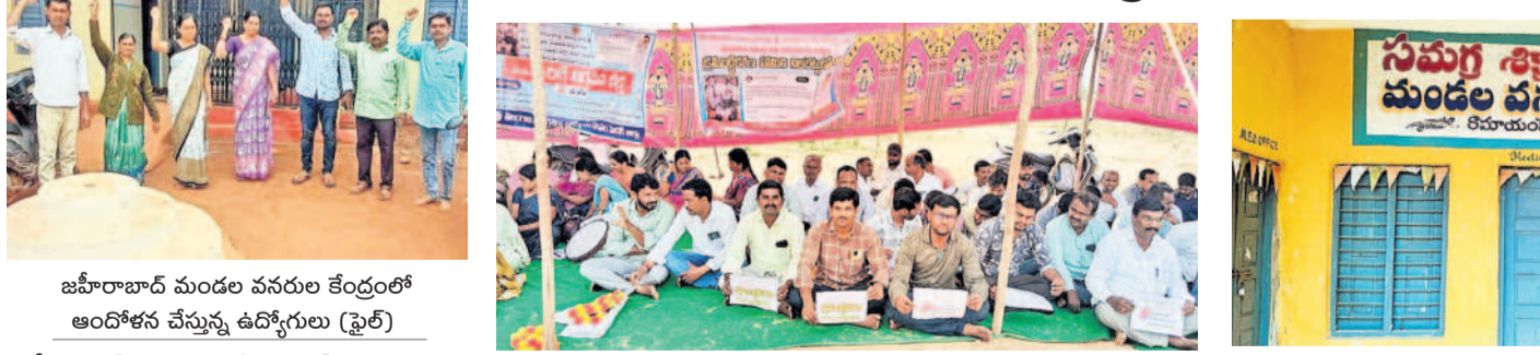
మెడక్ జిల్లా కేంద్రంలో కొనసాగుతున్న సమగ్ర శిక్షా ఉద్యోగుల సమ్మేది. జడి బయలుపిల్లలను గుర్తించి వివరాలను యూజిసీలో నమోదు చేయాలి అంటుంది. ఏకే ఉపాధ్యాయ పాఠశాలలో టీచర్ల సెలవులపై వెళ్లిపోవడం ఆ క్షేత్ర పరిధిలోని సీఆర్ డిఎ ఆ పాఠశాలను నడిపించాల్సి ఉంటుంది. సూపర్ ఓపెన్ స్కూల్ సమావేశాలు నిర్వహించడం, పాఠశాల ఖర్చుల వివరాల సేకరించి డిఈవోకు అందజేయాలి అంటుంది. ఎమ్మార్సీలో కంప్యూటర్ విద్యను సలంబించిన ప్రతిదీ నమోదు చేయాలి అంటుంది. సమ్మేది ఎమ్మార్సీ కార్యాలయాలను సేకరించి ఆ పనులన్నీ పూర్తిగా నిలిపి పోయాయి. దీంతో విద్యార్థుల చదువులపై తీవ్ర ప్రభావం చూపుతోంది. ఈ నెలఖర్చులోగా పదే తరగతి నిలబెట్టే పూర్తి చేయాలి ఉంది. మార్చిలో ఇంటర్ వార్షిక పరీక్షల ప్రారంభం కానుండడంతో రిజిస్ట్రేషన్, ప్రత్యేక తరగతులతో పాటు స్టడీ టెబులు నిర్వహించాల్సి ఉంటుంది. వారి సమ్మేది పదే తరగతి, ఇంటర్ వార్షిక పరీక్షలపై తీవ్ర ప్రభావం పడుతుందని విద్యార్థుల తల్లిదండ్రులు ఆందోళన చెందుతున్నారు. విద్యార్థులు అధ్యాపకులను సమ్మేదిగా ఉపాధ్యాయులు, అధ్యాపకులను సర్దుబాటు చేసే బాధ్యత ప్రభుత్వంపై ఎత్తినా ఉంది. ఉద్యోగులు, సిబ్బంది వ్యయంపై సమగ్ర పాల్గొంటున్నారని, పైసలు సాకాంక్షలు పెంచిన పరిస్థితులను ప్రభుత్వం పరిష్కరించాలి. పార్టీని ఇన్ స్పెక్టర్లు 12 నెలల వేతనం ఇవ్వాలి. ప్రభుత్వం వెంటనే తమ వ్యయంపై డిమాండ్ ను నెరవేర్చాలి. తనకు తమ సమ్మేది పరచి దిక్కుగా కొనసాగిస్తాం.