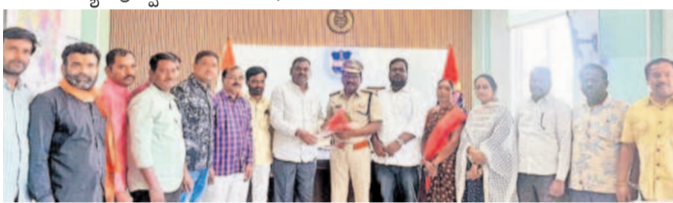
మెడక్, జనవరి 2 (నమస్తె తెలంగాణ): ఆంగ్ల నూతన సంవత్సరం సందర్భంగా కలిగి ఉన్న కార్యకర్తలను కలిసిన టీఎన్టీవోలు.

మెడక్, జనవరి 2 (నమస్తె తెలంగాణ): ఆంగ్ల నూతన సంవత్సరం సందర్భంగా కలిగి ఉన్న కార్యకర్తలను కలిసిన టీఎన్టీవోలు. ఆంగ్ల నూతన సంవత్సరం సందర్భంగా కలిగి ఉన్న కార్యకర్తలను కలిసిన టీఎన్టీవోలు. ఆంగ్ల నూతన సంవత్సరం సందర్భంగా కలిగి ఉన్న కార్యకర్తలను కలిసిన టీఎన్టీవోలు.