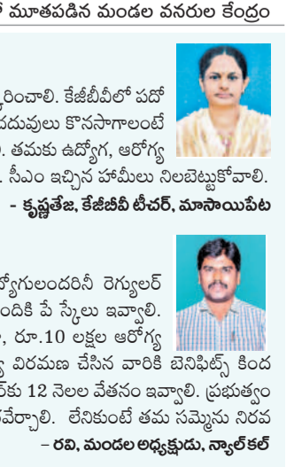
మండల కేంద్రమైన న్యార్కర్ గ్రామంలో మాతపడిన మండల పనితీరు కేంద్రం

మండల కేంద్రమైన న్యార్కర్ గ్రామంలో మాతపడిన మండల పనితీరు కేంద్రం. మండల కేంద్రమైన న్యార్కర్ గ్రామంలో మాతపడిన మండల పనితీరు కేంద్రం. మండల కేంద్రమైన న్యార్కర్ గ్రామంలో మాతపడిన మండల పనితీరు కేంద్రం.