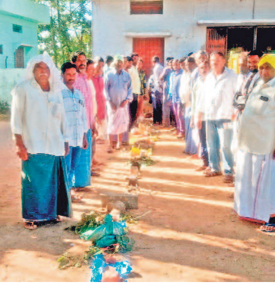
కాంగ్రెస్ రాజకీయ రైతులకు ఎరువుల కష్టాలు మళ్ళీ మొదలయ్యాయి. యూరియా కోసం సాఫ్ట్‌వేరు ఎదురు బారులు కనిపిస్తున్నాయి. నిజామాబాద్ జిల్లా ధర్మల, జిగితాల జిల్లా కడలాపూర్, ములుగు జిల్లా బయ్యారం మండలాల్లో యూరియా కోసం రైతులు అవస్థలు పడ్డారు.