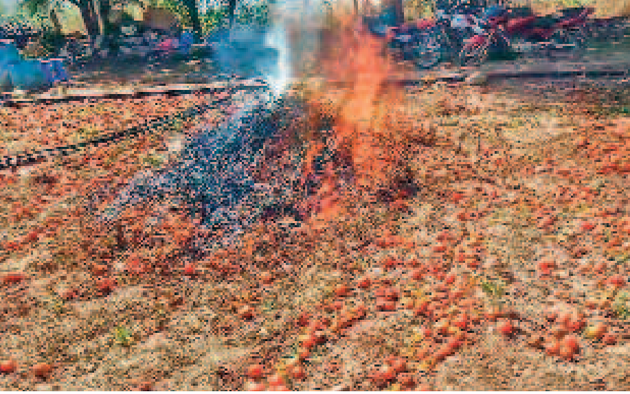
దశాల్కే ధర దక్కకుండాగా, టమాట పండించిన రైతుకు మాత్రం నష్టమే మిగులుతున్నది. మెదక్ జిల్లా శివ్వంపేట మండలం నవాబోపేటలో శుభ్రవారం ఐదెకరాల టమాట పంటను రైతులు దహనం చేశారు. లక్షల రూపాయలు పెట్టుబడి పెట్టి సాగు చేసే కనీసం కిరాయిలు కూడా గిట్టుబాటు కావడం లేదని రైతులు నల్ల హరిగోడ్, నల్ల రవిగోడ్ అనేక వ్యక్తం చేశారు. ఒక్కో క్రేట్ బ్యాక్ మీద కేవల 10 రూపాయలే మిగులుతున్నాయని వారు వాపోయారు.