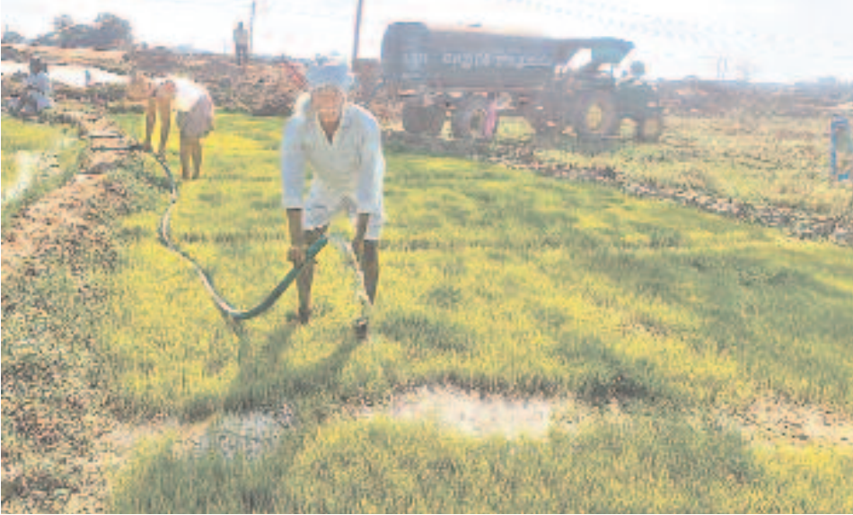
ప్రాంతాల్లో నుంచి నీటిని విడుదల చేయకపోవడంతో రైతులు నారును కాపాడుకోవడం కోసం నానా కష్టాలు పడుతున్నారు. పోచారం ప్రాంతాల్లో నుంచి నీటిని సర్కారు విడుదల చేయకపోవడంతో కామారెడ్డి జిల్లా నాగిరెడ్డిపేటలో ప్రధాన కాలువ కిందనే ట్యాంకర్లతో నీటిని తెచ్చి తుకం తడుపుతున్నారు. నల్లగొండ జిల్లా తుంగభద్రా నియోజకవర్గంలోని రైతులది ఇలాంటి పరిస్థితి. కాశ్యోరం నీటిని విడుదల చేయకపోవడంతో రైతులు బిందెలతో నీళ్లు తెచ్చి పొలాలు తడుపుకొంటున్నారు.