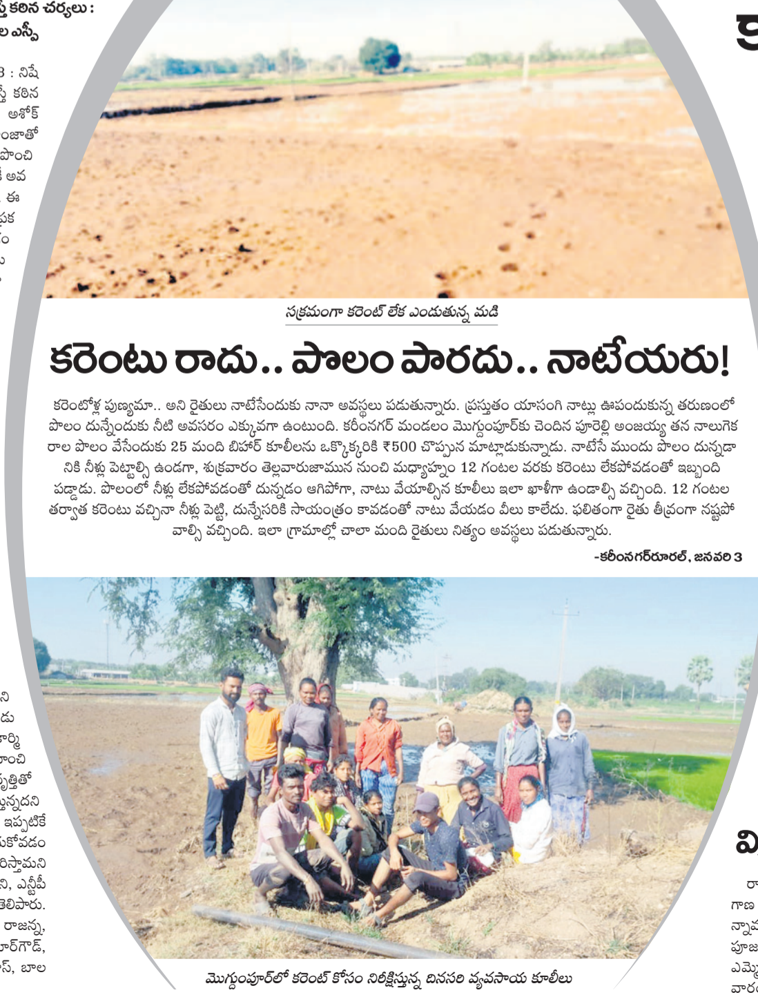
సక్రమంగా కరెంట్ లేక ఎందుకున్న మండి