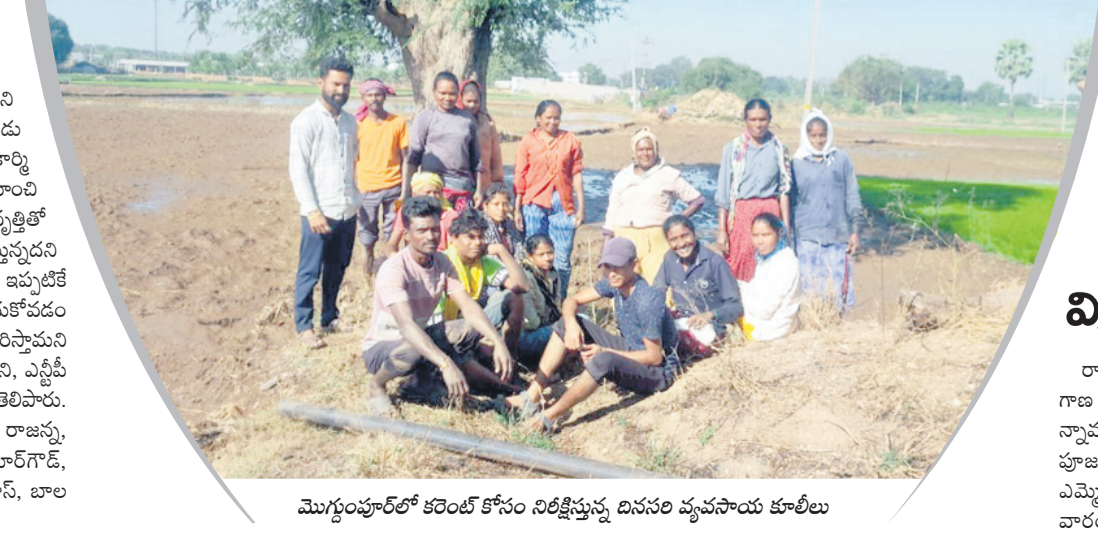
మొగ్గంపూర్ కరెంట్ కోసం నిరీక్షిస్తున్న దినసరి వ్యవసాయ కూలిలు