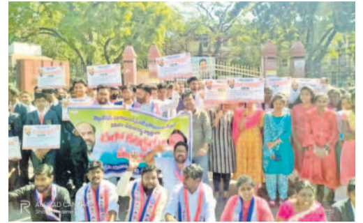
కరీంనగర్ కలెక్టరేట్ ఎదుట ధర్మా చేస్తున్న బీసీ యువజన సంఘం నాయకులు

కరీంనగర్ కలెక్టరేట్ ఎదుట ధర్మా చేస్తున్న బీసీ యువజన సంఘం ధర్మా