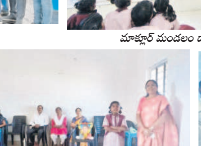
మోర్తాడ్లో సావిత్రిబాయిపూలే చిత్రపటం వద్ద నివాళులర్పిస్తున్న దళితసంఘం నాయకులు