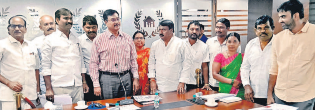
హైద్రా కమిషనరీ రంగనాథ్ ను కలిసిన గురుబ్రహ్మనగర్ బస్టివాసులు

అంజారా హిల్స్, జనవరి 4: జూబ్లీ హిల్స్ డివిజన్ గురుబ్రహ్మనగర్లో మరోసారి హైద్రా అధికారుల కలకలం చెలరేగింది. నందగిరి హిల్స్ కాలనీకి చెందిన పార్కు స్థలం అంటూ అందోళన చేశారు. వివరాల కోసం వెళ్తే... జూబ్లీ హిల్స్ నందగిరి హిల్స్ ను ఆనుకుని ఉన్న గురు బ్రహ్మనగర్ బస్టివాసులకు, నందగిరి హిల్స్ సొసైటీకి మధ్యన ఉన్న భారీ స్థలం విషయంలో చాలాకాలంగా వివాదం నడుస్తోంది. కాంగ్రెస్ ప్రభుత్వం అధికారంలోకి వచ్చిన