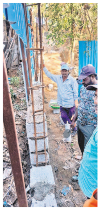
గురుబ్రహ్మనగర్ బస్టిని ఆనుకుని ప్రహారీ నిర్మిస్తున్న దృశ్యం