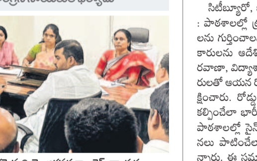
సీటీబ్యూరో, జనవరి 4 (నమస్తే తెలంగాణ)

పాఠశాలల్లో ట్రాఫిక్ పార్కుల ఏర్పాటుకు స్థలాలు గుర్తించాలని కలెక్టర్ అనుదీప దురిశెట్టి అధికారులను ఆదేశించారు. కలెక్టరేట్లో శనివారం రవాణా, విద్యాశాఖ, జీహెచ్ఎస్ఐ, పోలీసు అధికారులతో ఆయన రోడ్డు భద్రతా మాసోత్సవంపై సమన్వయం చేశారు. రోడ్డు భద్రతపై అందరికీ అవగాహన కల్పించేలా భారీ రోడ్లలో బెన్చులను సూచించారు. పాఠశాలల్లో సైన్ బోర్డులు ఇతర ట్రాఫిక్ నిబంధనలు పాటించేలా చర్యలు తీసుకోవాలని పేర్కొన్నారు. ఈ సమావేశంలో జాయింట్ ట్రాఫిక్ పోర్ట్ కమిషనర్ రమేష్, జిల్లా విద్యా శాఖాధికారి రోహిణి తదితరులు పాల్గొన్నారు.