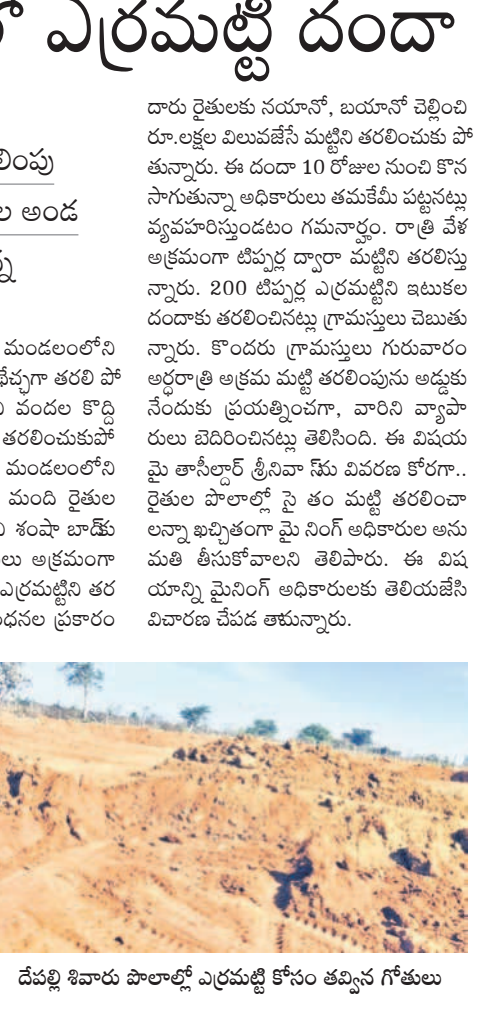
దేపల్లి శివారు పాఠశాలలో ఎర్రమట్టి కోసం తవ్విన గోతులు

రాత్రి వేళల్లో అక్రమంగా తరలింపు స్థానిక నాయకుల అండ చోద్యం చూస్తున్న అధికారులు నవాబ్ పేట, జనవరి 5 : మండలంలోని దేపల్లి నుంచి ఎర్రమట్టి దుప్పట్లుగా తరలింపు పోతున్నది. 10 రోజుల నుంచి మండల కార్యదర్శి దేపల్లిలో తరలింపును నిరోధించుకుంటున్నాడని తెలిపారు. ఈ విషయం తెలుసుకున్నా అధికారులు తమకేమీ పట్టనట్లు వ్యవహరించినట్లు తెలిపారు. రాత్రి వేళ అక్రమంగా తరలింపు ద్వారా మట్టి తరలింపు న్యాయాధికారుల పై నిరీతి అధికారులు అనుమతి లేకుండా తరలింపును నిరోధించారు. ఈ విషయం తెలుసుకున్నా అధికారులు తరలింపును నిరోధించారు. ఈ విషయం తెలుసుకున్నా అధికారులు తరలింపును నిరోధించారు. ఈ విషయం తెలుసుకున్నా అధికారులు తరలింపును నిరోధించారు.