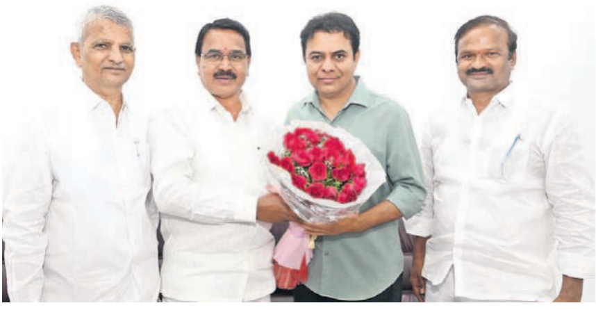
బీఆర్ఎస్ వర్కర్ల సైనిక దళం కేటీఆర్ ను అభినందనలు తెలిపారు. మహబూబ్ నగర్, సోమవారం 6 జనవరి 2025