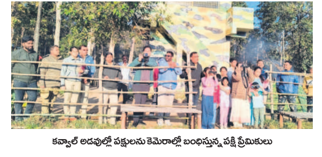
కవ్వాల అడవులో పక్షులను కెమెరాల్లో బంధిస్తున్న పక్షి ప్రేమికులు