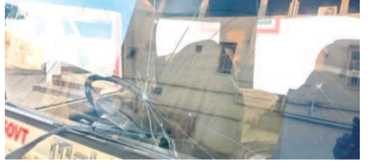
పగిలిన అటవీ శాఖ వాహన అద్దం