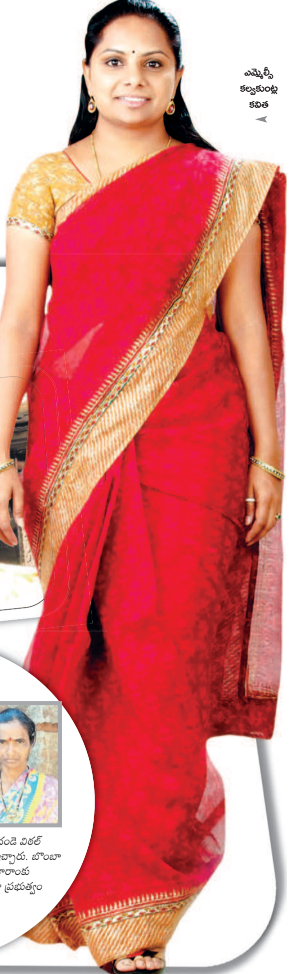
ఎమ్మెల్యే కల్యాణకుంట్ల కవిత