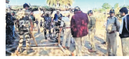
కేశవపట్నంలో కార్లను నిర్మల్ నిర్వహిస్తున్న అటవీ శాఖ సిబ్బంది

అధికారులు వెళ్లడంతో గ్రామస్థులు భయపడ్డారని, దీంతో ముద్రణ వాతావరణం నెలకొన్నది. అధికారులకు ఎటువంటి గాయాలు కాలేదన్నారు. 20 మంది సుగంధ గుర్తింప చేసినట్లు తెలిపారు. ముఖ్యంగా జగడ సందర్భంగా ఆయన మాట్లాడుతూ.. ఉద్దిక్తత ఎన్టీఆర్ రేవంట్ చంద్ర ఆధ్వర్యంలో దాడి చేసి నిల్వ ఉన్న కలను పట్టుకున్నామన్నారు. సాగిన కలను పట్టుకుంటామన్నారు. 3.50 ఉంటుంది మన దాదాపు రూ.3.50 ఉంటుంది అంటున్నారు. గ్రామంలోకి అటవీ శాఖ