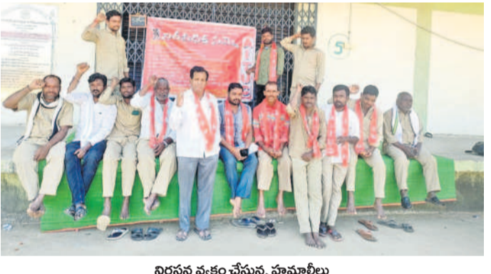
నిరసన వ్యక్తం చేస్తున్న హమాళీలు