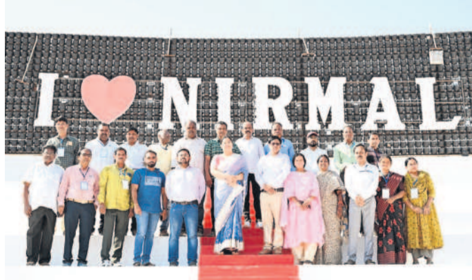
నిర్మల్ ఉత్సవాల ప్రారంభ కార్యక్రమంలో పాల్గొన్న కలెక్టర్, అధికారులు

కడెం నీటి విడుదల 694.650 అడుగులు (6.279 మీటర్లు) నీటి ఉన్నదని కడెం ప్రాజెక్టు ఈ కార్యక్రమంలో, డి.కె. సుబ్బారావు తెలిపారు. ఆయనకు కింద సాగుతున్న నిర్మల్, మంచిర్యాల జిల్లాల్లోని 17 వేల ఎకరాలకు వారంపాటి పట్టణం ఏర్పడినట్లు తెలిపారు. ప్రస్తుతం ప్రాజెక్టులో