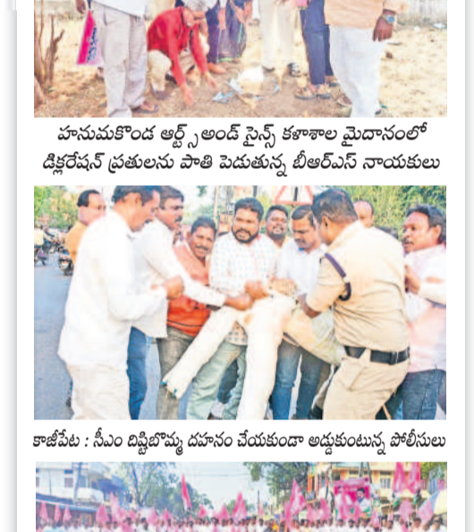
హనుమకొండలో డిక్టేషన్ ప్రకటన పాటి పెడుతున్న బీఆర్ఎస్ నాయకులు