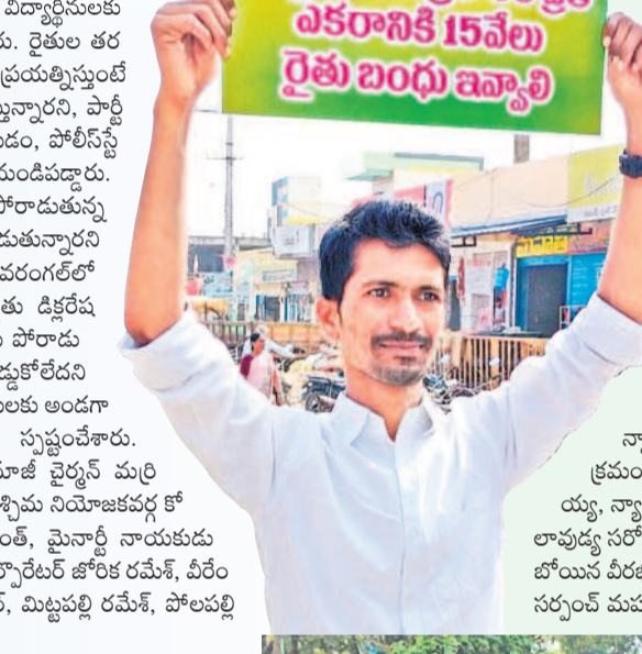
నెక్కిండ, జనవరి 6 : పండు గూడ ఉమ్మడి వ్యవసాయాన్ని పండుకడే అప్పుడే దానిని గానీ మరే పండుకడే అప్పుడే దానిని గానీ