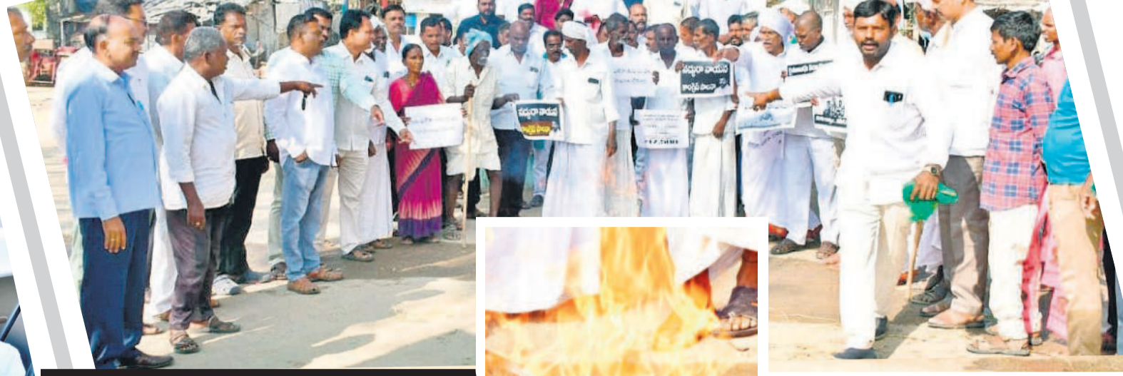
పెట్టుబడికి నిరసనలు - దద్దరిల్లిన ధర్మాలు

ఎదుట నల్ల బట్టలు ధరించి ధర్మా నిర్వహించే వ్యక్తులు చెప్పారు. అదే విధంగా ఈ నెల 8వ తేదీన, అమరవంక, 9వ కృష్ణ, మాగ నూర్, 10వ నర్స, ఊట్లూరు మండల కేంద్రాల్లోనూ బారీ ఎత్తున నిరసన కార్యక్రమాలు చేపట్టనున్నట్లు వెల్లడించారు. ఈ కార్యక్రమాల్లో బీఆర్ఎస్ శ్రేణులతోపాటు రైతులు అధిక సంఖ్యలో పాల్గొని జయప్రదం చేయాలని పిలుపునిచ్చారు.