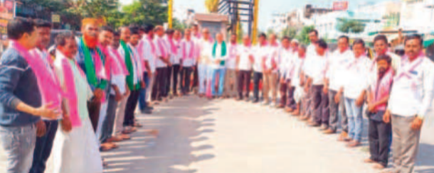
పేటలో నిరసన తెలుపుతున్న బీఆర్ఎస్ శ్రేణులు