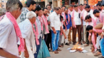
అడ్డూకులో హామీ పత్రాలను దహనం చేస్తున్న బీఆర్ఎస్ నాయకులు