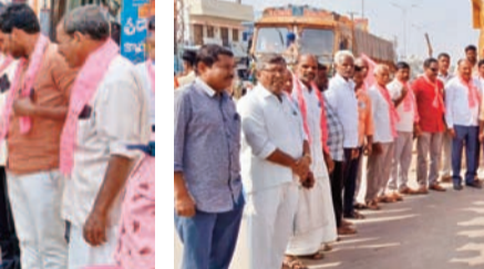
మరికల్: ఇందిరాగాంధీ చొరస్తాలో దర్జా నిర్వహిస్తున్న నాయకులు