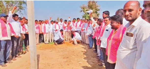
భూతూర్లో ప్రభుత్వ హామీలను పూడ్చిపెట్టిన బీఆర్ఎస్ నాయకులు