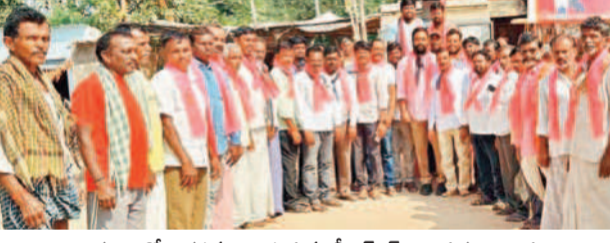
కొంకంట్లలో నిరసన తెలుపుతున్న బీఆర్ఎస్ నాయకులు, రైతులు

సివ్వ సీసీకుంట్ల, కొంకంట్ల మండల కేంద్రాల్లో బీఆర్ఎస్ కార్యకర్తలు భారీ సంఖ్యలో రైతులను నిరసనలకు దిగారు. రైతుల అన్యాయం బెదిరితే బీఆర్ఎస్ పార్టీ పోరాడే దుకు సిద్ధంగా ఉంటుంది ప్రభుత్వంపై మండిపడ్డారు. రైతులకు చెందిన పంట సాయం రైతుల ఆకంట్లలో జమచేయాలని డిమాండ్ చేశారు.