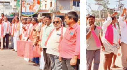
కొత్తపల్లి చొరస్తాలో దర్జా నిర్వహిస్తున్న బీఆర్ఎస్ నాయకులు