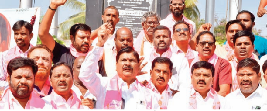
జిల్లా కేంద్రంలో నిరసన వ్యక్తం చేస్తున్న బీఆర్ఎస్ నాయకులు