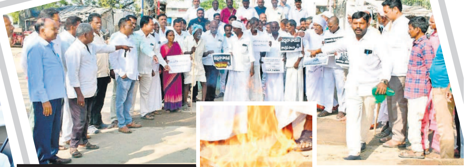
పెట్టుబడికి నిరసనలు - దద్దరిల్లిన ధర్మాలు