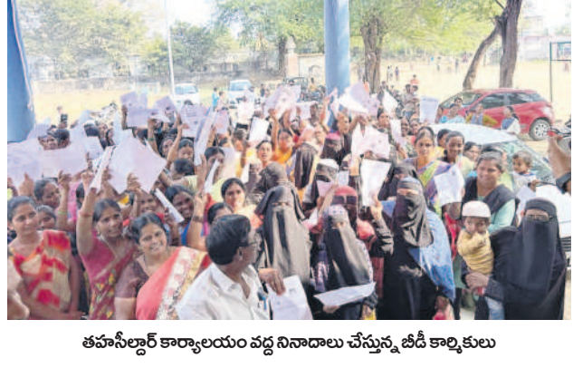
తహసీల్దార్ కార్యాలయం వద్ద నివాదాలు చేస్తున్న బీడీ కార్మికులు