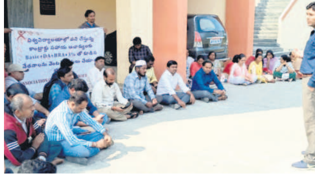
ధర్మా నిర్వహిస్తున్న ట్రీపుల్ ఐటీ కాంట్రాక్టు అసిస్టెంట్ ప్రొఫెసర్స్

అరణ్యవాసం అయ్యింది కాని అత్యగ్రహణం తో కూడిన వేతనం లేదని అన్నారు. కాంట్రాక్టు వ్యవస్థలో మా యొక్క సేవలను అందిస్తు, విద్యార్థులకు నాణ్యమైన విద్యను అందిస్తూ, వారి బంగారు భవిష్యత్తుకు బాటలు వేస్తున్నామని అన్నారు. గత ప్రభుత్వం నిర్ణయం తో కారణంగా చాలి చాలి జీతాలతో మా జీవనాన్ని కొనసాగిస్తున్నామని విధానం మా యొక్క ఆవేదనను ప్రభుత్వం దృష్టికి తీసుకెళ్ళి ఎలాంటి ప్రయోజనం లేకుండా పోయింది. ఈ ప్రభుత్వం అయిన వెంటనే స్పందించి తమకు జేసీఐ, ఎన్ఆర్ఎ, డీఏ, మూడు శాతం వార్షిక పెరుగుదలతో కూడిన జీతాలను ఇవ్వాలని డిమాండ్ చేశారు. అనంతరం 77 మంది అసిస్టెంట్ ప్రొఫెసర్స్ ఓపిటి, ఏవో లకు విసతి పత్రం అందజేశారు.