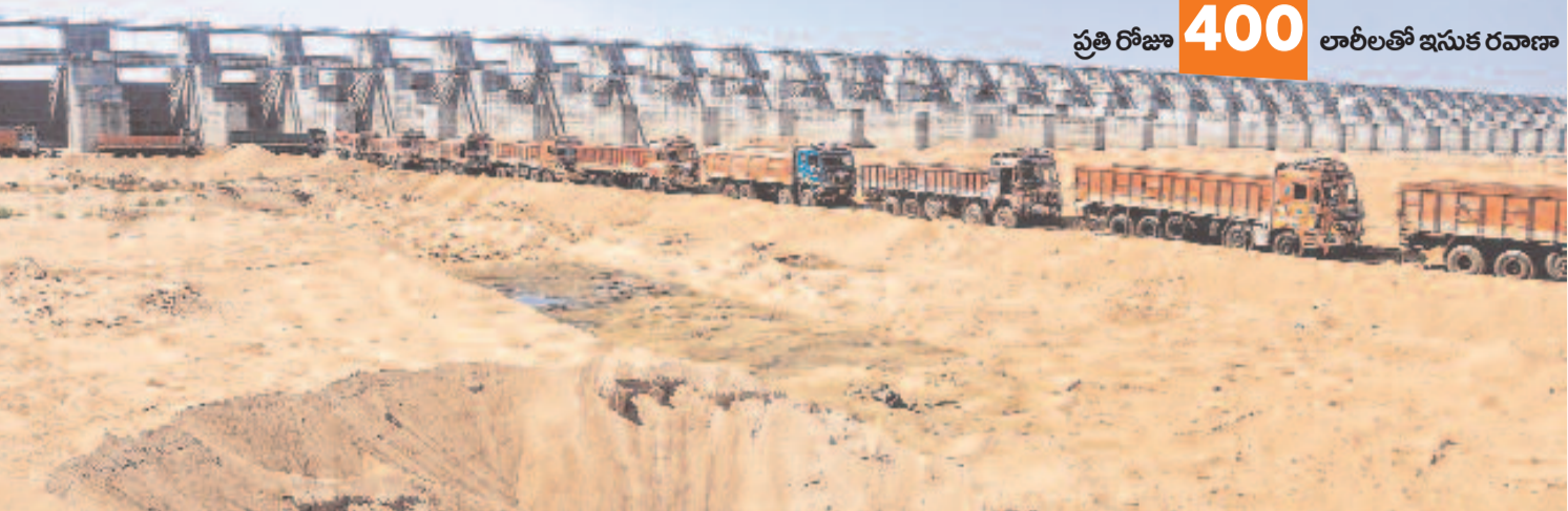
ప్రతి రోజూ 400 లాబీలతో ఇసుక రవాణా