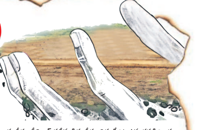
సంగీతం శ్రీనివాస్ సతీమణి సంగీతం విద్య పేరిట ఉన్న ధరణి రికార్డు

కాంగ్రెస్ నాయకుల కబంధ హస్తాల్లో ఏకరాల కొద్దీ అసైన్డ్ భూములు చిక్కుకున్నాయి. చాలా మంది నాయకులు సదరు అస్థలను ఏకైకంగా అనుభవిస్తున్నారన్న విషయం ఉంది. 2004 నుంచి 2014 వరకు అనాటి కాంగ్రెస్ ప్రభుత్వ హయాంలో ఆ ల్యాండ్స్ను కాజేసినట్లు బయటపడుతున్నది. గుట్టుపప్పుడు కాకుండా రికార్డుల్లో పేర్లు రాయించుకొని పట్టణాల పాస్తు పుస్తకాలు పొందడమే కాదు, కొంత మంది ఏకంగా క్రమవిక్రయాలు చేసినట్లు తెలుస్తున్నది. అయితే సినిల్ల నియోజకవర్గంలో బీఆర్ఎస్ నాయకులు తప్పకుండా రికార్డుల ద్వారా అసైన్డ్ భూములు ఆక్రమించుకున్నారంటూ అరెస్టులు చేస్తున్న విషయం తెలిసింది. అంతేకాదు, అరెస్టుల పరంపర ఇంకా కొనసాగుతుండనే సంతకాన్ని అధికార పార్టీ నాయకులు ఇస్తున్నారు. అలాగే ఏకరాల కొద్దీ అసైన్డ్ ల్యాండ్స్ను బీఆర్ఎస్ నాయకులు ఆక్రమించుకున్నారంటూ ప్రజల్లోకి తప్పకుండా వెళ్లాలి కుట్రలు చేస్తున్నారు. నిజానికి లోతుగా వెళ్తే ఎంతో మంది హస్తం నాయకులు అసైన్డ్స్ను చెరచుటూ, ఒకటి రెండేకరాలు కాదు, ఏకంగా ఐదేకరాలను కూడా కైవసం చేసుకున్న నాయకులున్నారు. అసైన్డ్ భూములను ఎంతకా అనుభవిస్తున్న పలువురు కాంగ్రెస్ నాయకుల జాబితా 'సమస్త తెలంగాణ' సంపాదించింది. వాటిని ప్రజలకు తెలుపడమే లక్ష్యంగా వివరాలు విస్తారంగా చేస్తున్నది. ఇవి ముప్పుకే అయినా.. లోతుగా వెళ్తే ఇంకా చాలా మంది అసైన్డ్ భూముల దండా బయటపడుతుంది.