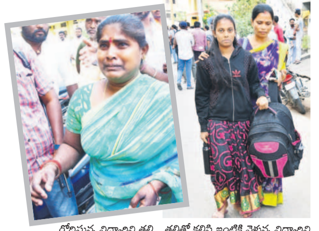
రోడ్డుపై విద్యార్థిని తల్లి తల్లితో కలిసి ఇంటికి వెళ్తున్న విద్యార్థిని

కరీంనగర్ కలెక్టరేట్, జనవరి 7: కరీంనగర్ లోని శర్వనగర్ మహా త్యాజ్యోత్సవాల్లో భాగంగా గురుకులంలో సోమవారం రాత్రి ఫుడ్ పాయిజన్ 31 మంది విద్యార్థినులు అస్వస్థతకు గురయ్యారు. కడుపునొప్పి, వాంటలు, విరేచనాలతో అల్లరాత్రి సుంచే బాధపడుతుండగా, వసతి గృహ ఆధికారి, సిబ్బంది వారిని ప్రభుత్వ దవాఖానకు తరలించి చికిత్స చేయించారు. విషయం తెలిసిన తర్వాత డాక్టర్లు ఆందోళనకు గురై, రోడ్డు దవాఖానకు చేరుకున్నారు. చికిత్స అనంతరం పిల్లలు కోలుకోవడం, ప్రమాదం ఏమీ లేదని వైద్యులు ప్రకటించడంతో తల్లిదండ్రులు, అధికారులు ఊపిరి పీల్చుకున్నారు. సాయంత్రం కల్లా విద్యార్థినులను హాస్టల్ కు తరలించారు. ఉన్నతాధికారుల ఆదేశాలతో అస్వస్థతకు గురైన వారికి అనారోగ్య సేవలు ఇచ్చి, ఇండ్లకు పంపించారు. ఈ ఘటనపై విద్యార్థి సంఘాల నాయకులు గురుకులం ఎదుట ఆందోళన చేశారు.