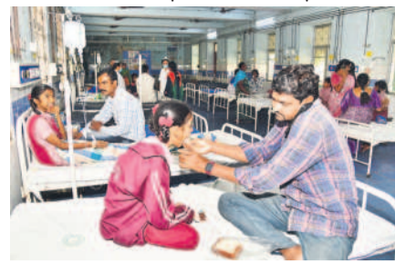
కరీంనగర్ ప్రధాన దవాఖానలో చికిత్స పొందుతున్న విద్యార్థినులు

కరీంనగర్ శర్వనగర్ విద్యాలయంలో 31 మంది విద్యార్థినులకు అస్వస్థత