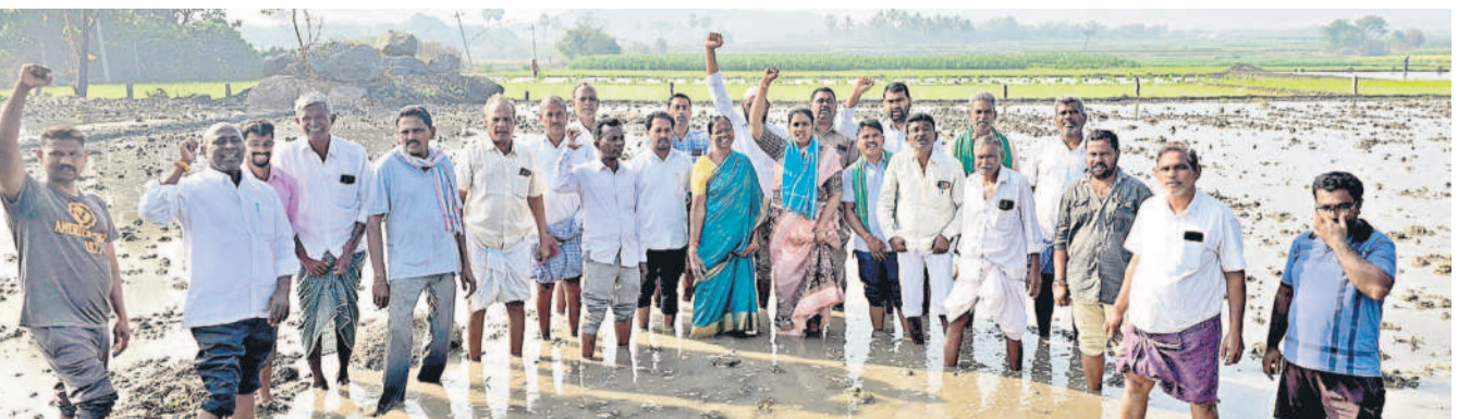
జగిత్యాల: పాలలో నిరసన వ్యక్తం చేస్తున్న జడ్పీ మాజీ చైర్మన్ దావ పనకం, రైతులు, నాయకులు

ముక్కరంపల్లెలోని ప్రభుత్వ ఈ-సేవ కేంద్రంపై అంతస్తులోని జిల్లా ఉపాధి కార్యాలయంలో శుక్రవారం ఉద్యోగ మేళా ఉంటుందని చెప్పారు. వివరాలకు 70991 72221, 72076 59969, 99082 30384లో సంప్రదించాలని సూచించారు.