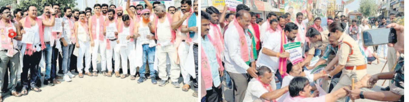
వేములవాడ: తెలంగాణ వాక్ వర్ష అధ్యనగ్న ప్రదర్శనలో బీఆర్ఎస్ నాయకులు