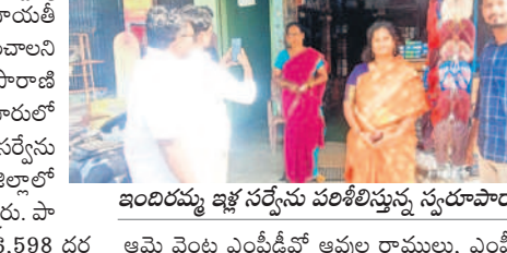
ఇందిరమ్మ ఇళ్ల సర్వేను పరిశీలిస్తున్న స్వరూపారాణి

చేపట్టిన ఇందిరమ్మ ఇళ్ల సర్వేను పారదర్శకంగా కార్యదర్శులు, సిబ్బంది పారదర్శకంగా నిర్వహించాలని జిల్లా పంచాయతీ అధికారి ఎన్ స్వరూపారాణి అన్నారు. మంగళవారం మండలంలోని గూడూరులో జిపీ కార్యాలయం, పాలకుర్తిలో ఇందిరమ్మ ఇళ్ల సర్వేను అందించడంపై ఇళ్ల సర్వే 95 శాతం పూర్తయిందన్నారు. పాలకుర్తి మండలంలో ఇందిరమ్మ ఇళ్ల కోసం 18,598 దరఖాస్తులు వచ్చాయన్నారు. పంచాయతీ కార్యదర్శులు గ్రామాల్లో పరిసారం పరిశీలనలు చేయాలన్నారు.