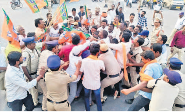
జనగామ పౌరస్థాలో సీఎం రేవంత్ రెడ్డి దివ్యబాహును దూకడం చేస్తున్న బీజేపీ కార్యకర్తలను అడ్డుకుంటున్న పోలీసులు