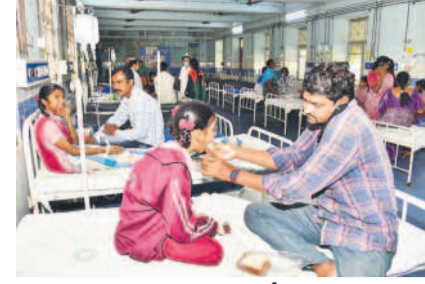
కరీంనగర్ ప్రధాన దవాఖానలో చికిత్స పొందుతున్న విద్యార్థినులు

కరీంనగర్ శర్వనగర్ విద్యాలయంలో 31 మంది విద్యార్థినులకు అస్వస్థత