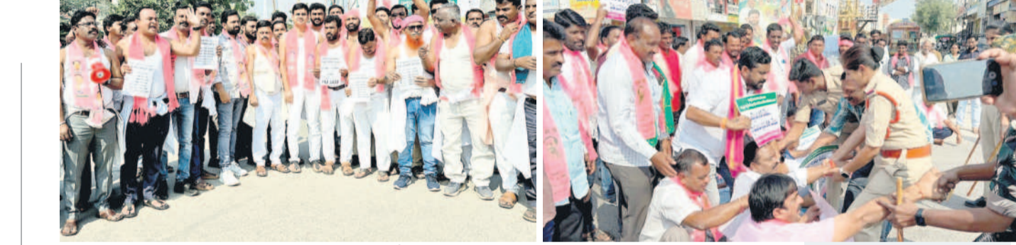
వేములవాడ: తెలంగాణ పోక్ వద్ద అర్జున్ గృహ ప్రదర్శనలో బీఆర్ఎస్ నాయకులు

కరీంనగర్ డెయిలీపై పాలిటాకు కంట్లో బోర్డు (పీసీబీ)కు ఫిర్యాదు చేశారని, అటువంటి వాటిని డెయిలీ పరంగా స్వాగతిస్తున్నారని, ఆ మేరకు సంబంధిత అధికారులు వచ్చి పరిశీలించి ఇచ్చిన సూచనలు అమలు చేశామని చెప్పారు. కానీ, కొంతమంది మాత్రం డెయిలీ పాలిటా కేసులకు కలుపుకున్నారు, సీట్ మిక్స్ చేస్తున్నారు, వినియోగిస్తున్న సీట్లలో చుట్టుపక్కల ప్రాంతాల్లో టీడీపీని పెడుతున్నారని, డెయిలీ నుంచి వివరాలు విడుదలవుతున్నాయని, తద్వారా చుట్టుపక్కల కాలనీలో చర్యలు చేస్తున్నారని, పిల్లలు వికలాంగులూ పుడుతారని, అలాంటివి అవుతాయంటూ నోటికి వచ్చినట్లు వివరాలు చేస్తున్నారని మండిపడ్డారు. వీటిని డెయిలీ పరంగా ఛార్జి ఖండిస్తున్నారని ప్రకటించారు. కొంతమంది ప్రైవేట్ డెయిలీ లతో కలిసి ఈ దుమ్ము ప్రసారం చేసి టీడీపీని పెడుతున్నట్లు భావిస్తున్నారన్నారు. డెయిలీ చుట్టుపక్క ప్రాంతాలకు ఎటువంటి హాని లేకుండా అనేక రకాల చర్యలు తీసుకుంటున్నామని, పాలిటా సీట్ల