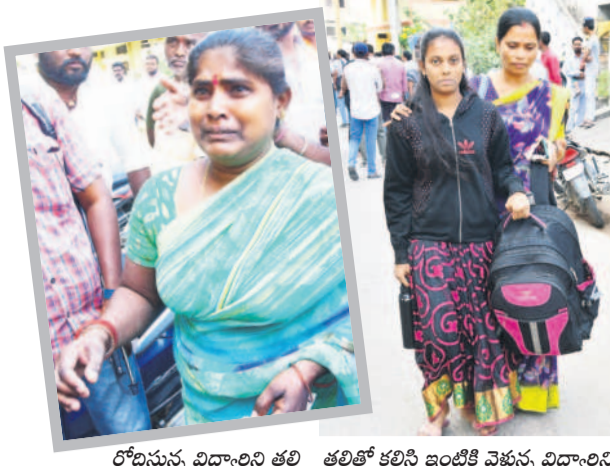
రోడ్డుపై విద్యార్థిని తల్లి తల్లితో కలిసి ఇంటికి వెళ్తున్న విద్యార్థిని

కరీంనగర్ కలెజ్ ఆఫ్ ఎడ్యుకేషన్, జనవరి 7: కరీంనగర్ లోని శర్వనగర్ మహా కాలనీ ఫుడ్ పాయిజన్ 31 మంది విద్యార్థినులకు అస్వస్థతకు గురైనట్లు తెలుస్తోంది. కడుపుబ్బ నొప్పి, వాంటలు, విరేచనాలతో అల్లరాల్ని సుంచే బాధపడుతుండగా, వసతి గృహ ఆధికారి, సిబ్బంది వారిని ప్రభుత్వ దవాఖానకు తరలించి చికిత్స చేయించారు. విషయం తెలిసిన తర్వాత కరీంనగర్ లోని శర్వనగర్ మహా కాలనీ ఫుడ్ పాయిజన్ 31 మంది విద్యార్థినులకు అస్వస్థతకు గురైనట్లు తెలుస్తోంది. కడుపుబ్బ నొప్పి, వాంటలు, విరేచనాలతో అల్లరాల్ని సుంచే బాధపడుతుండగా, వసతి గృహ ఆధికారి, సిబ్బంది వారిని ప్రభుత్వ దవాఖానకు తరలించి చికిత్స చేయించారు. విషయం తెలిసిన తర్వాత కరీంనగర్ లోని శర్వనగర్ మహా కాలనీ ఫుడ్ పాయిజన్ 31 మంది విద్యార్థినులకు అస్వస్థతకు గురైనట్లు తెలుస్తోంది. కడుపుబ్బ నొప్పి, వాంటలు, విరేచనాలతో అల్లరాల్ని సుంచే బాధపడుతుండగా, వసతి గృహ ఆధికారి, సిబ్బంది వారిని ప్రభుత్వ దవాఖానకు తరలించి చికిత్స చేయించారు.