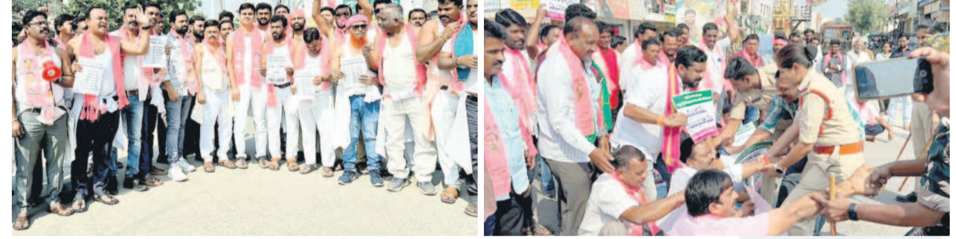
వేములవాడ: తెలంగాణ వాక్ వర్ష అధ్యనగ్న ప్రదర్శనలో బీఆర్ఎస్ నాయకులు