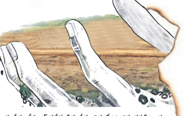
సంగీతం శ్రీనివాస్ సతీమణి సంగీతం విద్య పేరిట ఉన్న ధరణి రికార్డు

కాంగ్రెస్ నాయకుల కబంధ హస్తాల్లో ఎకరాల కొద్దీ అసైన్డ్ భూములు చిక్కుకున్నాయి. చాలా మంది నాయకులు సదరు అస్థలను ఏళ్లకేళ్లుగా అనుభవిస్తున్నారన్న విషయం తెలుసుకుంటే.. 2004 నుంచి 2014 వరకు అనాటి కాంగ్రెస్ ప్రభుత్వ హయాంలో ఆ ల్యాండ్స్ ను కాజీనీసట్టు బయటపడుతున్నది. గుట్టుపప్పుడు కాకుండా రికార్డుల్లో పేర్లు రాయింకొని పట్టాదారు పాసు పుస్తకాలు పొందడమే కాదు, కొంత మంది ఏకంగా క్రయవిక్రయాలు చేసినట్లు తెలుస్తున్నది. అయితే సిరిసిల్లా నియోజకవర్గంలో టీఆర్ఎస్ నాయకులు తప్పుడు రికార్డుల ద్వారా అసైన్డ్ భూములు ఆక్రమించుకున్నారంటూ అరెస్టులు చేస్తున్న విషయం తెలిసిందే. అంతేకాదు, అరెస్టుల పరంపర ఇంకా కొనసాగుతుండనే సంతకాన్ని అధికార పార్టీ నాయకులు ఇస్తున్నారు. అలాగే ఎకరాల కొద్దీ అసైన్డ్ ల్యాండ్స్ ను బీఆర్ఎస్ నాయకులు ఆక్రమించుకున్నారంటూ ప్రజల్లోకి తప్పుడు సంతకాలు వెళ్లాలి కుట్రలు చేస్తున్నారు. నిజానికి లోతుగా వెళ్తే ఎంతో మంది హస్తం నాయకులు అసైన్డ్ ను చెరచేస్తారు. ఒకటి రెండెకరాలు కాదు, ఏకంగా ఐదెకరాలను కూడా కైవసం చేసుకున్న నాయకులున్నారు. అసైన్డ్ భూములను ఎంచుకొని అనుభవిస్తున్న వలుపురు కాంగ్రెస్ నాయకుల జాబితా వివరాలు బహిష్కారం చేస్తున్నది. ఇవి ముఖ్యమంత్రి అయిన.. లోతుగా వెళ్తే ఇంకా చాలా మంది అసైన్డ్ భూముల దండా బయటపడుతుంది.