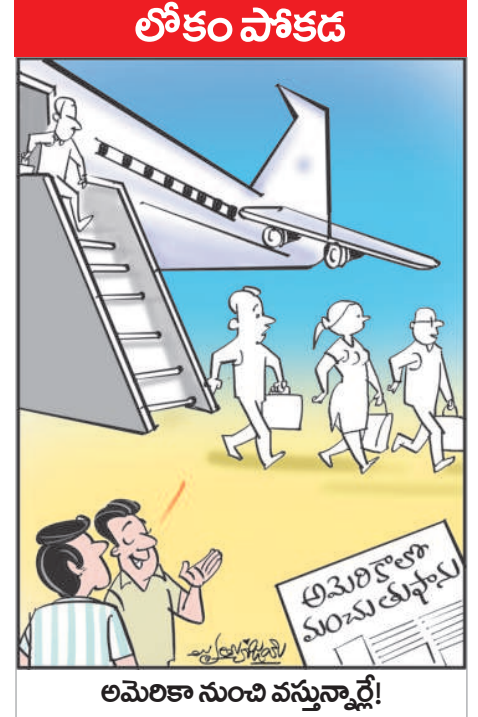
అమెరికా నుంచి వస్తున్నారే!

తెలంగాణ ప్రజలకు కాంగ్రెస్ ప్రభుత్వం ఇచ్చిన హామీలపై నిలదీయాలని శ్రేణులకు కేటీఆర్ పిలుపునిచ్చారు. లగచర్ల రైతులకు తమ పార్టీ పెట్టిన రోజున ఉండి ఇబ్బందులతో పోల్చితే.. అది ఇబ్బందే కాదు. కేసీఆర్ ఆనాడు కడుపు మ కేసులు పెట్టి పైకావికాసం పొందుతున్నారని మాజీ ఉప ముఖ్యమంత్రి మహమూద్ అలీ విమర్శించారు. ఆరు గ్యాంపింటి అమలు చేయలేక ప్రజలను తప్పుదోవ పట్టించేందుకు సకల ప్రయత్నాలు చేస్తున్నారని ఆరోపించారు. రైతు భరోసా కింద ఏటా 15 వేలు ఇస్తామని 12 వేలే చేయడంతో అన్నదాతలు నిలదీస్తున్నారు.. వారిని డైరీలో చేసేందుకు డ్రామా పై చేస్తున్నారని విమర్శించారు.