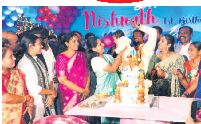
చిన్నారిని ఎత్తుకొని ముద్దు చేస్తున్న ఎమ్మెల్యే కల్వకుంట్ల కవిత

చెందిన గుర్తింపం. కాంగ్రెస్ నాయకుడు ఎల్లె లక్ష్మీనారాయణ తండ్రి పేరు రాజయ్య. తండ్రి పేరు గమనించకపోవడం వల్ల జరిగిన పొర పాటుతో కాంగ్రెస్ నాయకుడికి చెందిన భూమిగా ప్రచురితమైంది. ఈ స్థలంతో మాజీ ఛోరీ లీడర్ ఎల్లె లక్ష్మీనారాయణకు ఎటువంటి సంబంధం లేదు. తప్పగా ప్రచురణ జరిగిన విషయాన్ని తెలుసుకొని బుధవారం ఉదయమే నమస్తే తెలంగాణ నెట్ ఎడిషన్ ను మార్చాం. జరిగిన పొరపాటుకు చింతించడంతోపాటు పూర్తి వివరణ ఇస్తున్నాం.