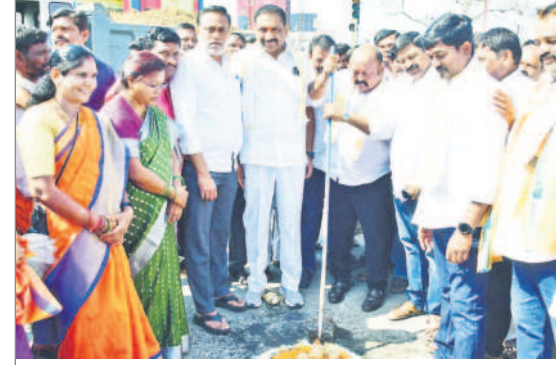
వద్దనగర్ జంక్షన్ బలాండ్ నిర్మాణానికి భూమి పూజ చేస్తున్న ఎమ్మెల్యే గంగుల

మాజీ మంత్రి, కరీంనగర్ ఎమ్మెల్యే గంగుల కమలాకర్