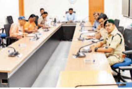
వీడియో హాజరైన కలెక్టర్, అదనపు కలెక్టర్, అధికారులు

మిగతా భూమిని త్వరలోనే గుర్తింపును బయటిచేయాలి అన్నారు.