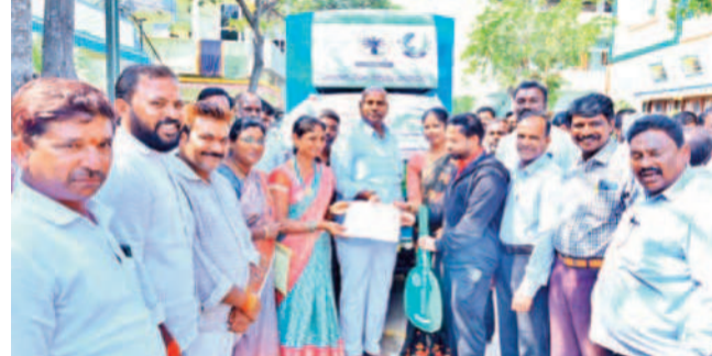
చేపల సంచార వాహన తాళాలు అభివృద్ధి అందించేందుకు మత్స్యకారుల సంక్షేమం కోసం ప్రభుత్వం కృషి చేస్తుంది