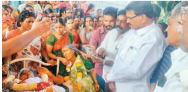
పార్లమెంటులోని సేవకులకు మాజీ మంత్రి పరామర్శ