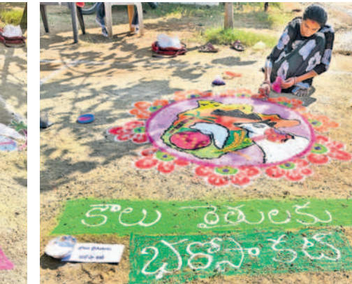
కాంగ్రెస్ సర్కారు హామీలను ప్రశ్నిస్తూ హనుమకొండ బీఆర్ఎస్ కార్యాలయంలో ముగ్గులు వేస్తున్న మహిళలు