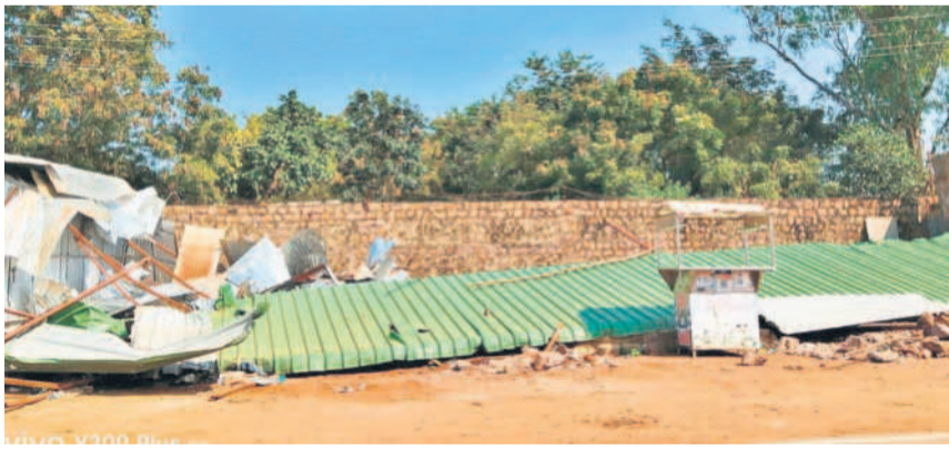
కూల్చిన బీఆర్ఎస్ మాజీ ఉపసర్పంచ్ కుటుంబం చెందిన దుకాణాలు (ఫైల్)