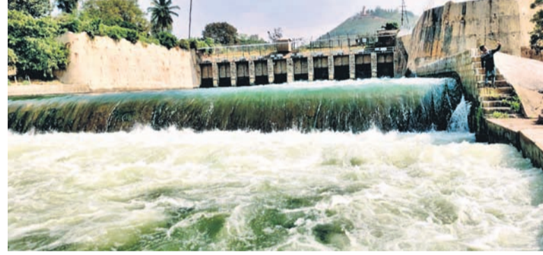
కర్ణాటకలోని శుంగభద్ర డ్యాం నుంచి నదిలోకి విడుదలవుతున్న నీరు