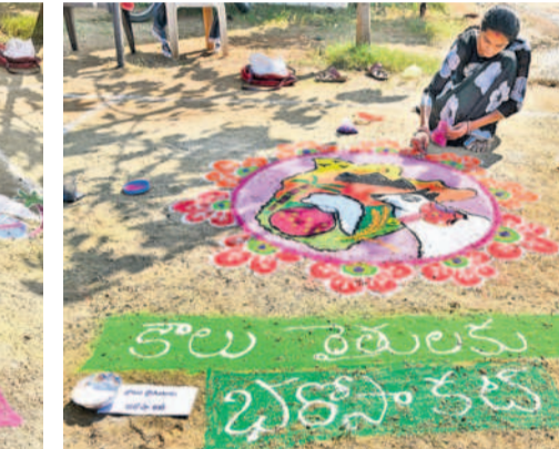
కాంగ్రెస్ సర్కారు హామీలను ప్రశ్నిస్తూ హనుమకొండ బీఆర్ఎస్ కార్యాలయంలో ముగ్గులు వేస్తున్న మహిళలు