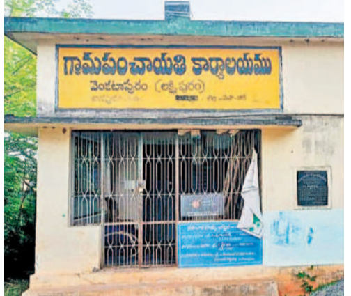
వెంకటాపురం పంచాయతీ భవనం

బయ్యారం, జనవరి 8 : ఇందిరమ్మ ఇండ్ల సర్వే తుది దశకు చేరుకోగా మహబూబాబాద్ జిల్లా బయ్యారం మండలంలోని ఓ రెండు గ్రామపంచాయతీల్లో మాత్రం సర్వే ప్రారంభం కాకపోవడంతో అక్కడి ప్రజలు తమకు ఇండ్ల పన్నయా? రావా? అంటూ అందోళన చెందుతున్నారు. మండలంలో 29 జిల్లీలు ఉండగా 27 పంచాయతీల్లో ఇందిరమ్మ ఇండ్ల సర్వే తుది దశకు చేరుకుంది. కానీ ఇందిరమ్మ ఇండ్ల సర్వే యిం ఓపేషన్ చేసే అల్లిగూడెం, వెంకటాపురం (లక్ష్మీపురం) పంచాయతీల పేర్లు మాత్రం చూపించడం (లాగ్) లేదు. దీంతో అక్కడ ఇంకా ఇందిరమ్మ ఇండ్ల సర్వే ప్రారంభం కావేదు. వెంకటాపురం జిల్లాలో లక్ష్మీ