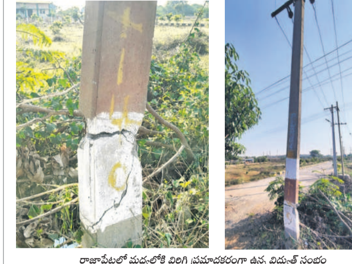
రాజాపేటలో మధ్యలోకి విరిగి ప్రమాదకరంగా ఉన్న విద్యుత్ స్తంభం