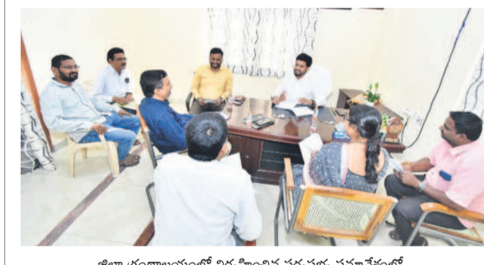
జిల్లా గ్రంథాలయంలో నిర్వహించిన సర్వసభ్య సమావేశంలో పాల్గొన్న గ్రంథాలయ సంస్థల చైర్మన్లు