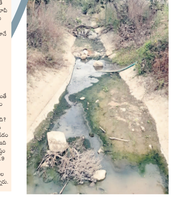
వెంకటపూర్ శివారులో ఎస్సార్ డి-40 కాలువ దుస్థితి

జగిత్యాల రూరల్, జనవరి 9: అర్జిత, నైపుణ్యమున్న సిగ్నిల్ కార్మికులకు తెలంగాణ ఓపెన్ రోజుల వరకు కంపెనీ లిమిటెడ్ టామ్ కామ్ కార్మికుల, ఉపాధి క్షేత్రం, కార్మికుల శాఖ కింద సింగపూర్ లో ఉద్యోగావకాశాలు కల్పిస్తున్నదని జగిత్యాల జిల్లా ఉపాధి కల్పన అధికారి సత్యగురువారం ఒక ప్రకటనలో పేర్కొన్నారు. సింగపూర్ లో మేన్, స్ట్రీట్ ఫిక్చర్ల కోసం ఖాళీలు ఉన్నాయని తెలిపారు.