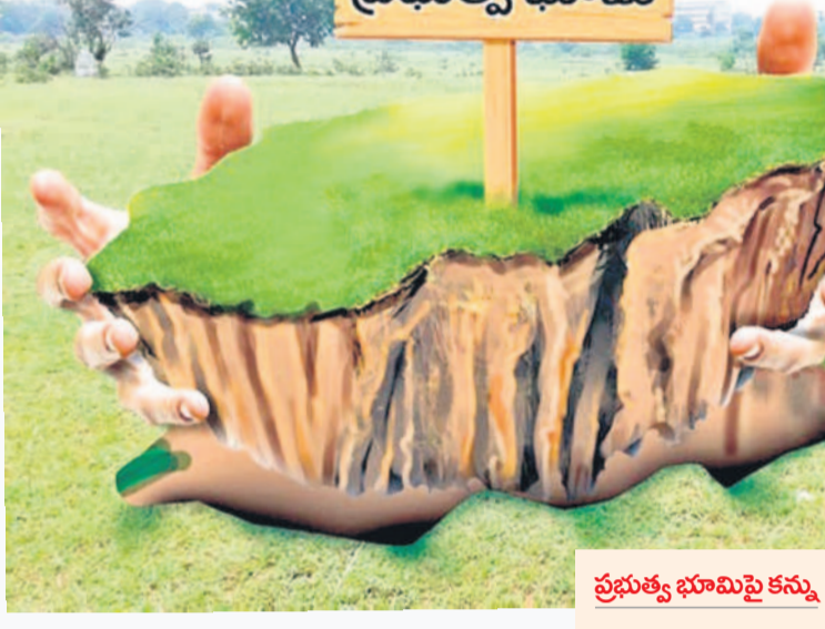
ప్రభుత్వ భూమిపై కన్ను

కరీంనగర్ ను ఆనుకొని ఉన్న బొమ్మకల్ లో కోట్ల విలువ చేసే ప్రభుత్వ భూములపై అక్రమార్కులు కన్నేశారు. దర్గాహా తమ భూమిలో కలిపేసుకుంటున్నారు. ఇప్పటికే అనేక జాగ్రత్తలు చెరిబట్టిన భూ బహుసూరులపై ప్రభుత్వం ఓ వైపు విచారణ చేస్తుండగానే, మరోవైపు అక్రమణలకు దిగుతున్నారు. పట్టా భూముల పక్కన ప్రభుత్వ భూమి కనిపిస్తే చాలు.. తమ జాగ్ కింద రాయంపకుంటున్నారు. అందుకు రాజీవరహితంగా నాలుగు అడుగుల దూరంలో 'సర్వే నంబర్ 58/ఎఫ్' ఉదాహరణగా నిలుస్తున్నది. 2017 వరకు అందులో 20 గుంటలే ఉండే.. ఆ తర్వాత ఏకంగా ఆ 1.32 ఎకరాలకు మారడం కల్వలకు అద్దం పడుతున్నది. తాజాగా ఇదే సర్వే నంబర్ పక్కన ఉన్న గవర్నమెంట్ ల్యాండ్ ను అక్రమించే పనిలో ఉన్నట్లు తెలుస్తున్నది. దీనిపై ఫిర్యాదులు అందినా పట్టించుకోవడం పట్ల అక్రమణలు రోజురోజుకూ పెరుగుతున్నట్లు తెలుస్తుండగా, అధికారుల తీరు విమర్శలకు తావిస్తున్నది.