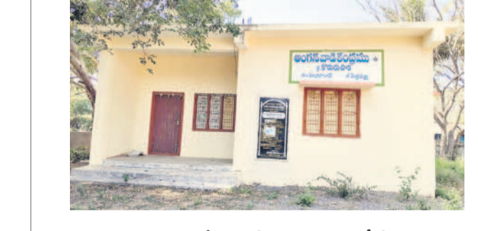
కోడురుపాకలో తాళం వేసి ఉన్న అంగన్ వాడీ కేంద్రం

ఎస్సార్ డి కాలువలు రూపురేఖలు కోల్పోయాయి. ఎన్నోవిభాగాల రైతుకు భరోసా ఇచ్చి, సాగుకు ఆదరువుగా మారిన వెంకటపూర్ ఇప్పుడు వూడికతో అడ్డా సంగా మారిపోయాయి. అందుకు కారణం మండలంలో ఎనిమిది గ్రామాలకు నీరందించే వెంకటపూర్ శివారులో ఎస్సార్ డి-40 కాలువ నిదర్శనంగా నిలుస్తున్నది. వందలాది ఎకరాల ఆయకట్టు కలిగిన ఈ కెనాల్ పిచ్చి ముక్కలతో నిండిపోయింది. ఈ సీజన్ లో సాగుకు నీరందే అవకాశం లేకుండా పోగా, రైతులు ఆందోళన చెందుతున్నారు. అధికారులు స్పందించి కాలువను పునరుద్ధరించాలని కోరుతున్నారు. - కోర్టులూరర్, జనవరి 9