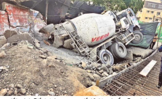
గోషా మహల్లో కూలిిన నాలా, నాలాలో పడి పోయిన రెడి మిక్స్ వాహనం

అధికారులు చేతులు దులుపుకున్నారే తప్పా, పక్కా పనులు చేపట్టేందుకు చర్యలు తీసుకోలేదని ప్రజలు ఆరోపిస్తున్నారు. ఇదిలా ఉండగా, 2022వ సంవత్సరం అక్టోబర్ 23వ తేదీన నాలా చాణాని భవన పక్క వీధిలో అందులో పడి పోయింది. కారణం యల బండ్లు నిలిపి ఉండగా, ఒక్క సారిగా నాలా కుప్ప కూలి కాదు, ద్విచక్ర వాహనాలు, కార్యకర్తలు వ్యాపారులు, కార్యకర్తలు అన్ని అందులో పడి పోయాయి. అప్పుడే రాష్ట్ర పుక సంవర్ధక శాఖ మంత్రి తలసాని శ్రీనివాస్ యాదవ్ చూడటం చూడటం చూడటం చేరుకుని కూలిని నాలాను సందర్శించి తక్షణమే నాలా మరమ్మతుల కోసం ప్రత్యేక నిధులను విడుదల చేయగా అధికారులు సంవత్సరం పాటు నాలా మరమ్మతు పనులు చేపట్టారు. నాలా పనులు భవన వైస్ ముందు భాగం మీదుగా నాలాపై నుంచి భారీ లోడ్తో కూడిన లారీ వెళ్తున్న సమయంలో నాలాపై కప్పు కూలి పోయింది. అప్పుడు మరమ్మతులను చేపట్టి