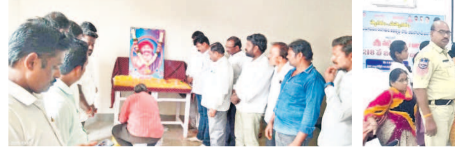
నిర్మల్ వైస్ గేట్ : వడ్డే ఓబన్న చిత్రహాసానికి పూలమాల వేసి నివాళులర్పిస్తున్న అధికారులు