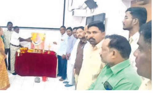
ఎదులాపురం : నివాళులర్పిస్తున్న అధికారులు