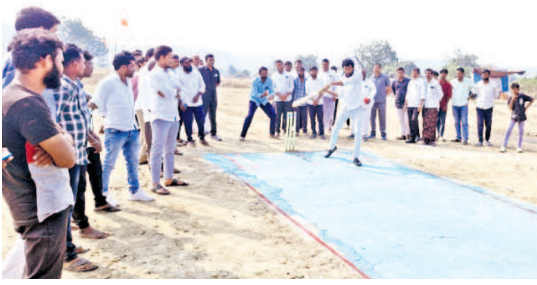
ధన్వంతరీ (బీ)లో క్రికెట్ ఆడుతున్న ఎమ్మెల్యే అనిల్ జాదవ్