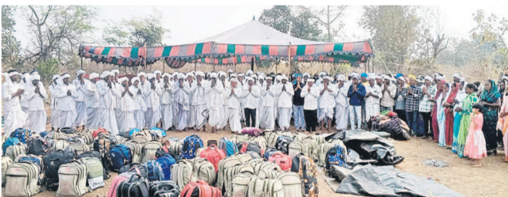
బట్టగూడలో రురికి పూజలు చేస్తున్న మెన్రం వంశీయులు

కాంప్లెక్సులకు ఎదురుగా ఉన్న దుకాణాలను తీసేసేందుకు చర్యలు తీసుకోవాలన్నారు.